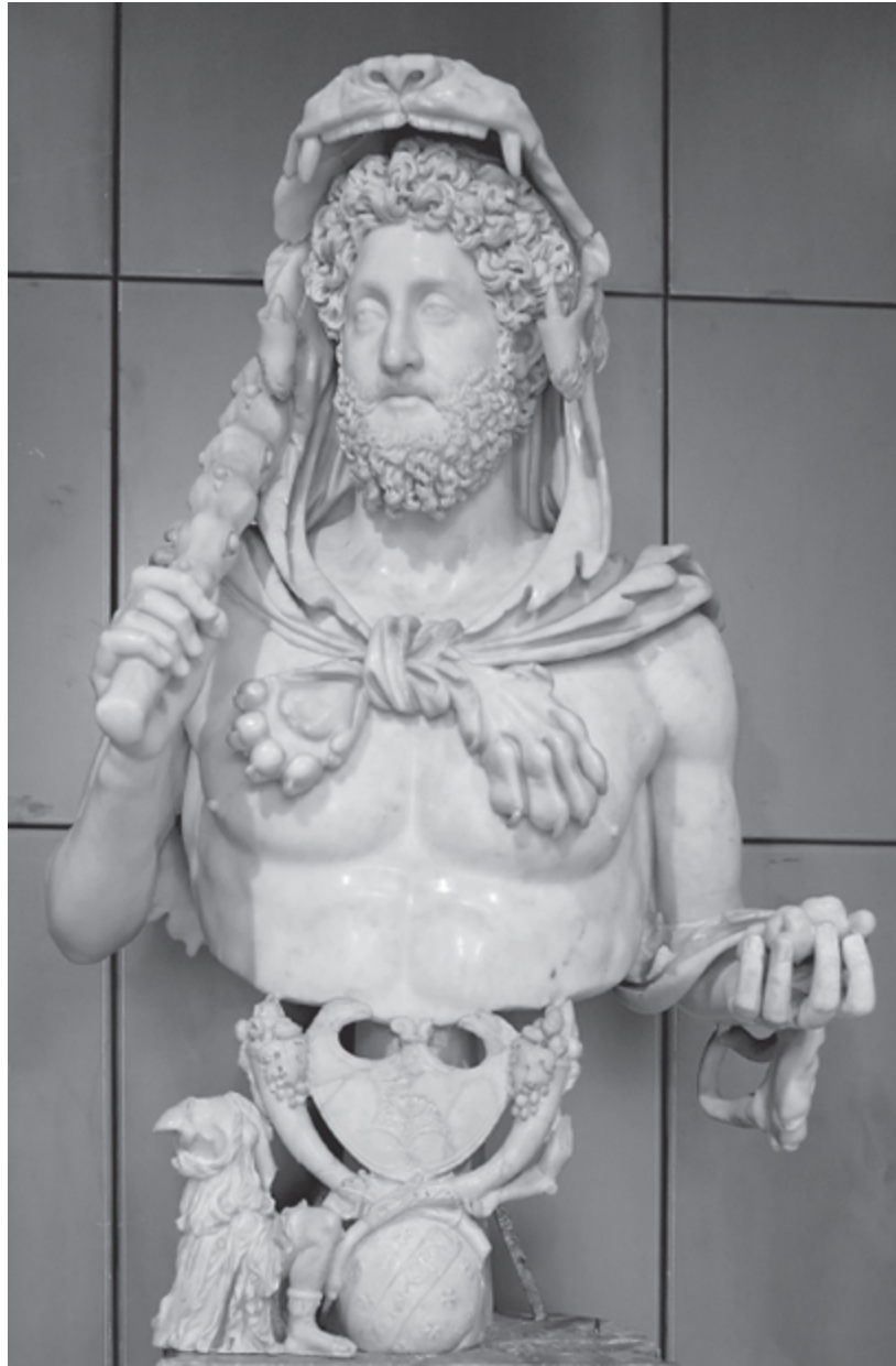
Kaiser Commodus (180-192 n. Chr.). Dargestellt als Herkules mit Löwenfell und Keule. Marmor, 192 n. Chr., Kapitolinische Museen, Rom.