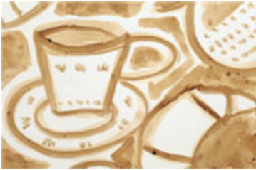
¡Mmm!... ¡Qué olor tan bueno!