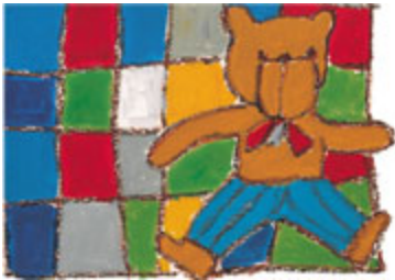
¿Es mi osito de peluche?