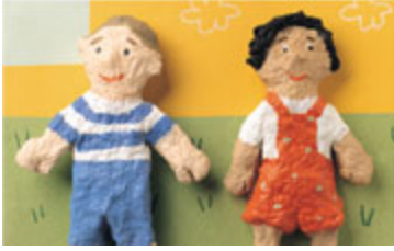
El color de mi piel