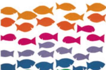
Do, re, mi, fa, sol