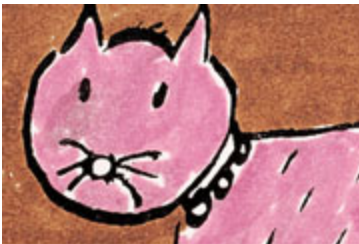
Un mismo gato, pero gatos diferentes