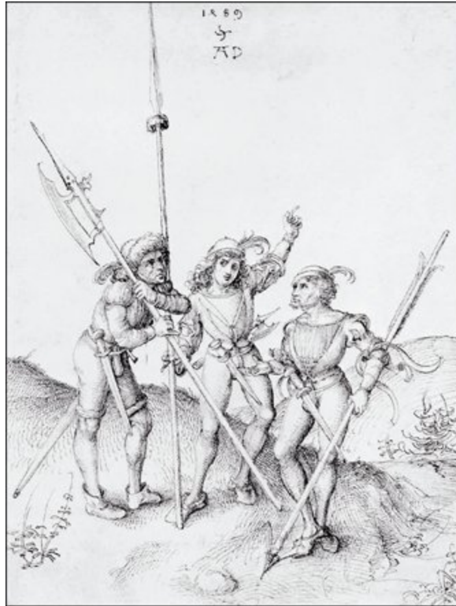
3. Krieger , um 1489. Federzeichnung, 22 x 16 cm. Staatliche Museen, Berlin.