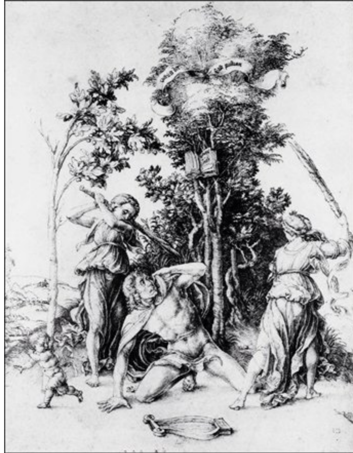
4. Der Tod des Orpheus , um 1494. Federzeichnung, 28.9 x 22.5 cm. Kunsthalle, Hamburg.