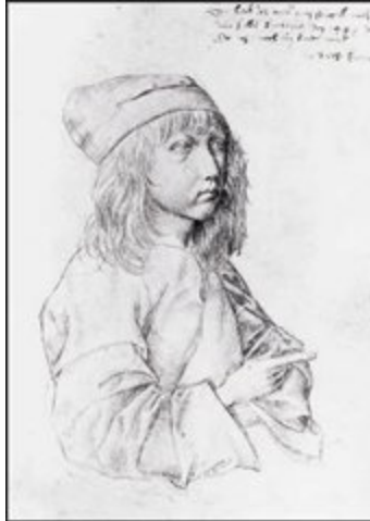
2. Selbstbildnis , um 1484. Silberdrahtstift, 27,5 x 19,6 cm. Graphische Sammlung, Albertina, Wien.