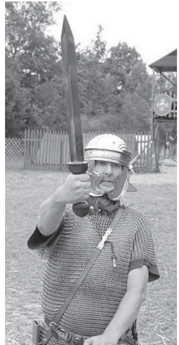
Gladius und lorica hamata -Kettenhemd