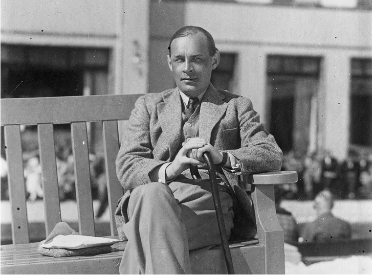
Erich Maria Remarque im Jahr 1929

Nach dem Presseball bleibt Remarque deshalb nur noch für eine kurze Nacht im Hotel. Wer nach Schleicher der neue Kanzler wird, betrifft ihn im Grunde gar nicht mehr, genauso wenig wie die Frage, ob dieser Ball der letzte Tanz der Republik war. Sonntagfrüh setzt er sich gleich nach dem Frühstück in seinen Wagen, einen Lancia Dilambda – er liebt schnelle Autos und hohes Tempo –, und startet Richtung Schweizer Grenze. Es ist eine lange, kalte Fahrt, von Nord nach Süd quer durch das winterliche Deutschland. Erst knapp zwanzig Jahre später wird er seine Heimat wiedersehen.