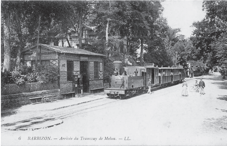
6 BARBIZON. — Arrivée du Tramway de Melun. — LL.

Die gute Erreichbarkeit von Paris aus ist einer der Gründe für die Attraktivität Barbizons. Während die frühen Reisenden in die Patache , die berühmte Knochenschüttler-Kutsche, steigen müssen (links), fährt später die Tramway direkt in den Weiler (rechts).