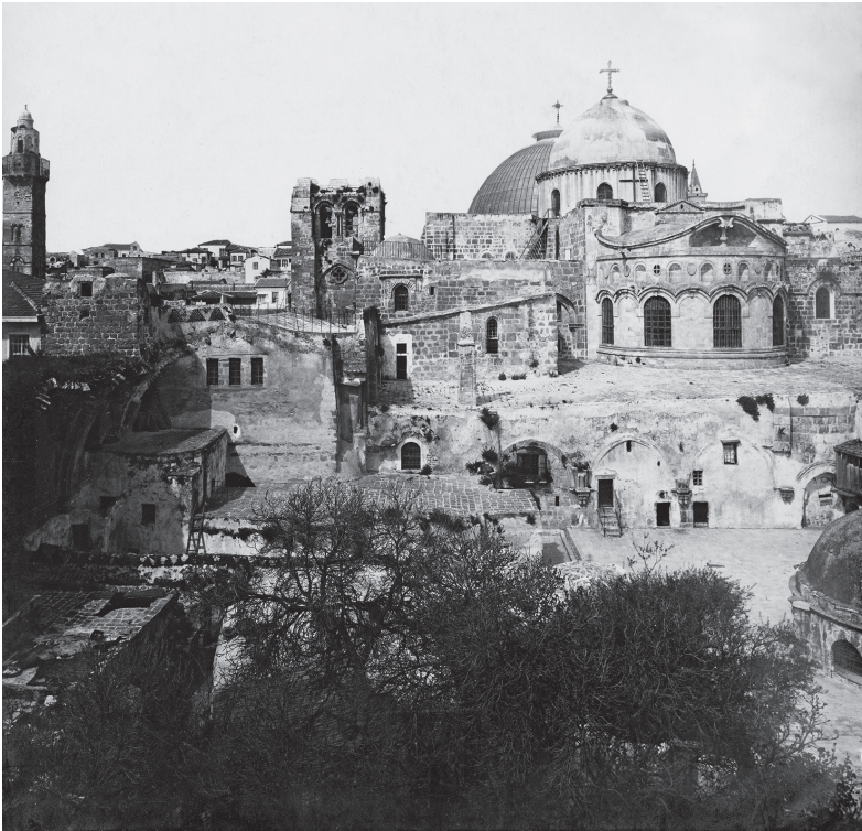
Mit dem Bau der Grabeskirche durch Konstantin den Großen im Jahr 335 am Golgatha-Felsen verschob sich das Zentrum Jerusalems. Aufnahme vom Ende des 19. Jahrhunderts.

lage, deren Hauptelemente – das Heilige Grab im Westen, Golgatha und die Konstantinsbasilika im Osten – im Wesentlichen auf einer Achse lagen, stellte gleichzeitig eine architektonische Situation dar, wie sie auf dem einstigen Tempelplatz bestanden hatte. 85