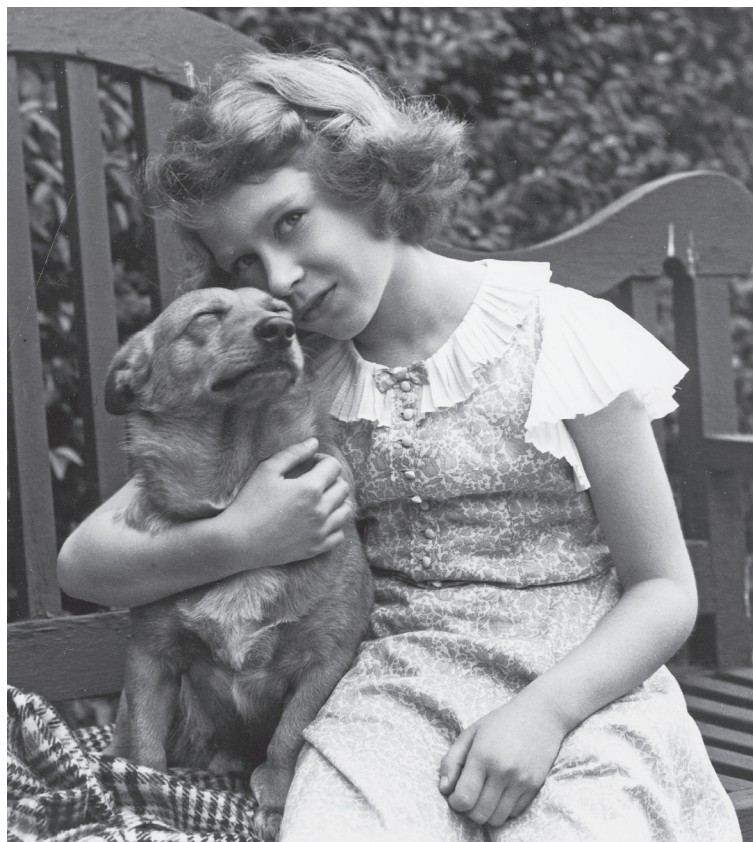
Corgi and Bess: Die zehnjährige Prinzessin Elizabeth mit Hund im Garten von 145 Piccadilly, Juli 1936

verknüpft – oder verwirrt? – waren, was den Grund gelegt haben muss zu der Scheu und der tastenden Vorsicht, die man der Queen nachsagt. Sie war nie eine Schauspielerin wie ihre temperamentvollere Schwester oder auch die Mutter, die einen ausgeprägten Sinn für Theatralik besaß. Alles war und ist für sie eine ernste Performance mit verpflichtenden Regeln. Das musste man lernen und über sich ergehen lassen, aber im Gegensatz zu ihrem Onkel David, dem späteren Edward VIII., lehnte sie sich, wie wir noch sehen werden, nicht dagegen auf.