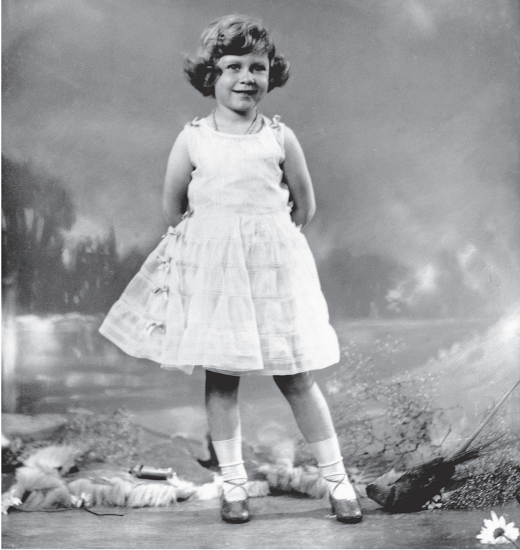
Shirley Temple bekommt Konkurrenz: Elizabeth im Alter von fünf Jahren, Februar 1931

von George V. und Queen Mary sowie der schottischen Großeltern Lord und Lady Strathmore, die in der Grafschaft Hertfordshire in dem Flecken St Paul's Walden nördlich von London einen gemütlichen Landsitz besaßen.