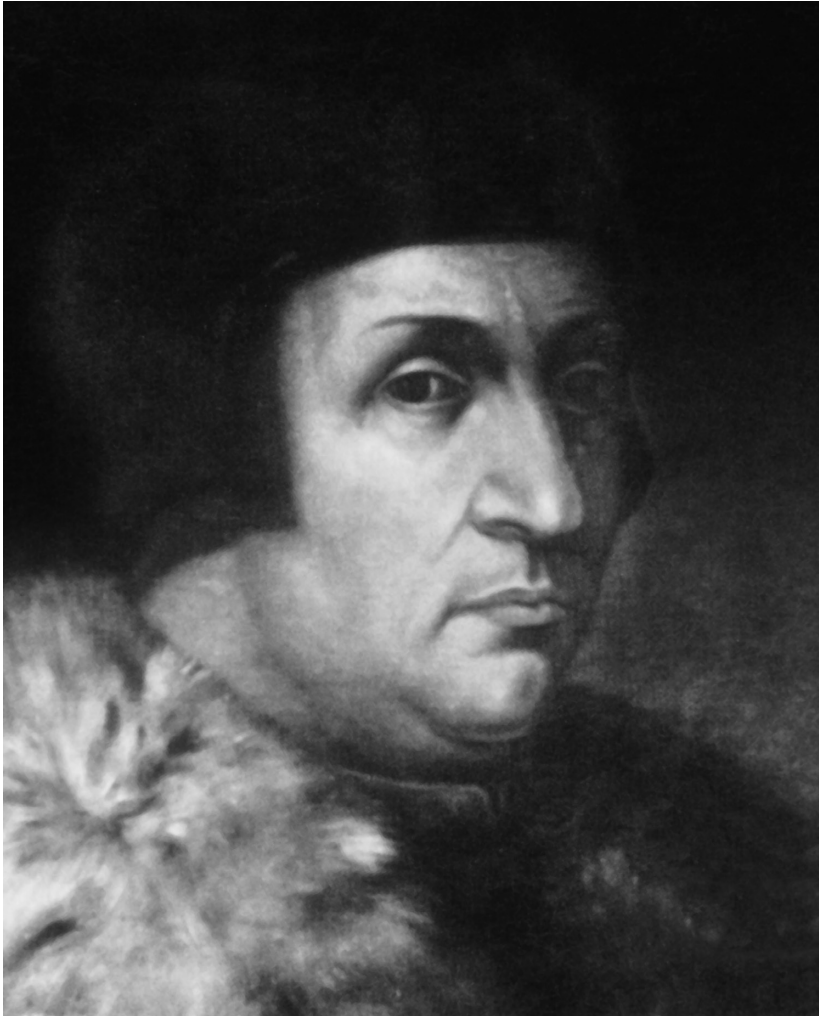
Porträt des Francesco Guicciardini

Gedankenschwer im Staatsgewand, so zeigt das Cristoforo dell'Altissimo zugeschriebene Porträt Francesco Guicciardinis den Florentiner Patrizier. Zugleich ist der Betrachter versucht, in die melancholischen Züge des vorzeitig gealterten Historikers und Staatsdenkers Todesnähe und Verachtung der Welt, speziell ihrer Mächtigen, hineinzulesen. Vor allem aber ist das Bildnis gemalte Memoria, ein Werk des Gedächtnisses und des Gedenkens für die Familie. Sie hat diesen Auftrag getreulich erfüllt; das Studierzimmer des – so Felix Gilbert – größten Intellektuellen der Renaissance im Palazzo von Oltrarno erweckt den Eindruck, als habe er soeben erst die Feder aus der Hand gelegt.