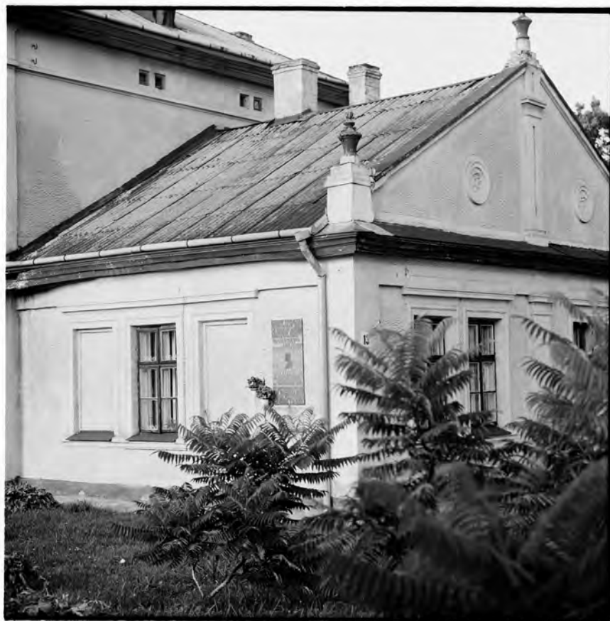
Grodek, Galizien, ehemalige Feldambulanz