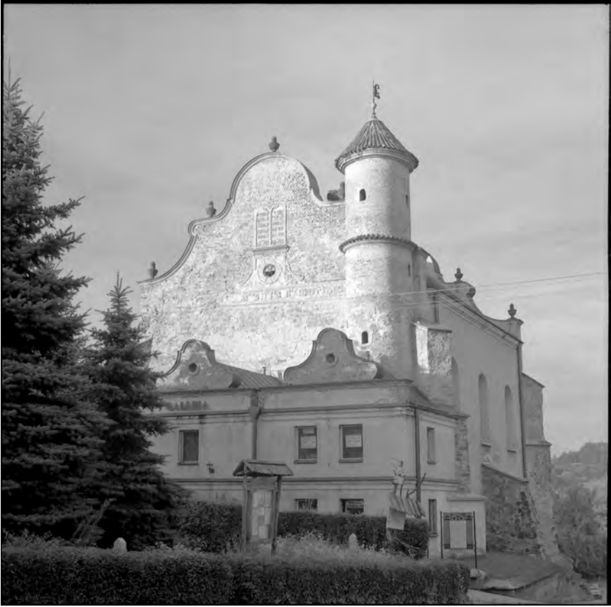
Lesko, ehemalige Synagoge (17. Jh.), © M.S. 2000