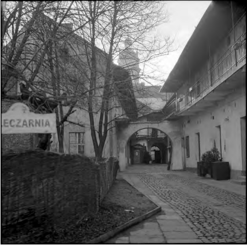
Krakau, Kazimierz, jüdischer Hof