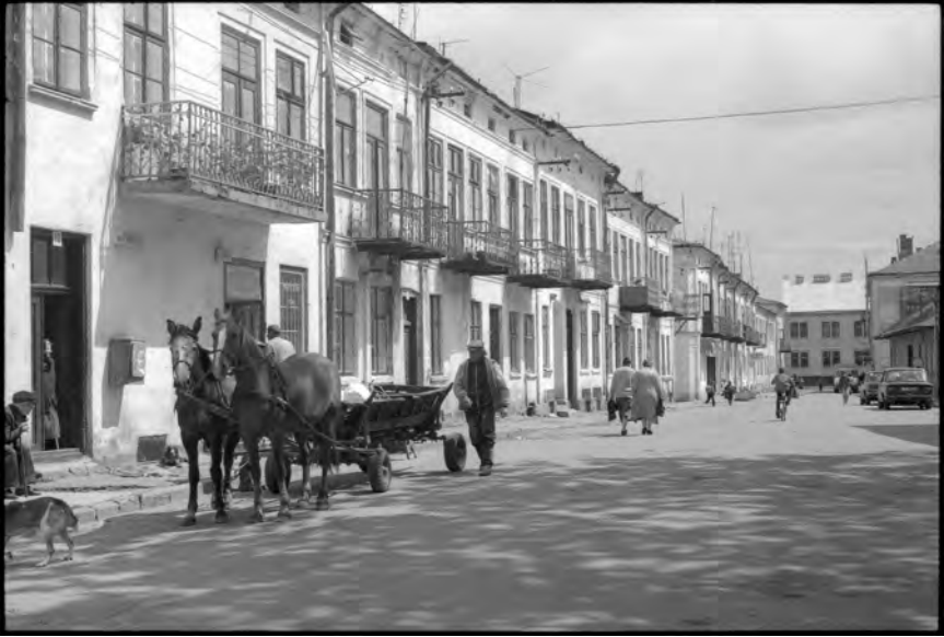
Radziechow, Ostgalizien, Markt