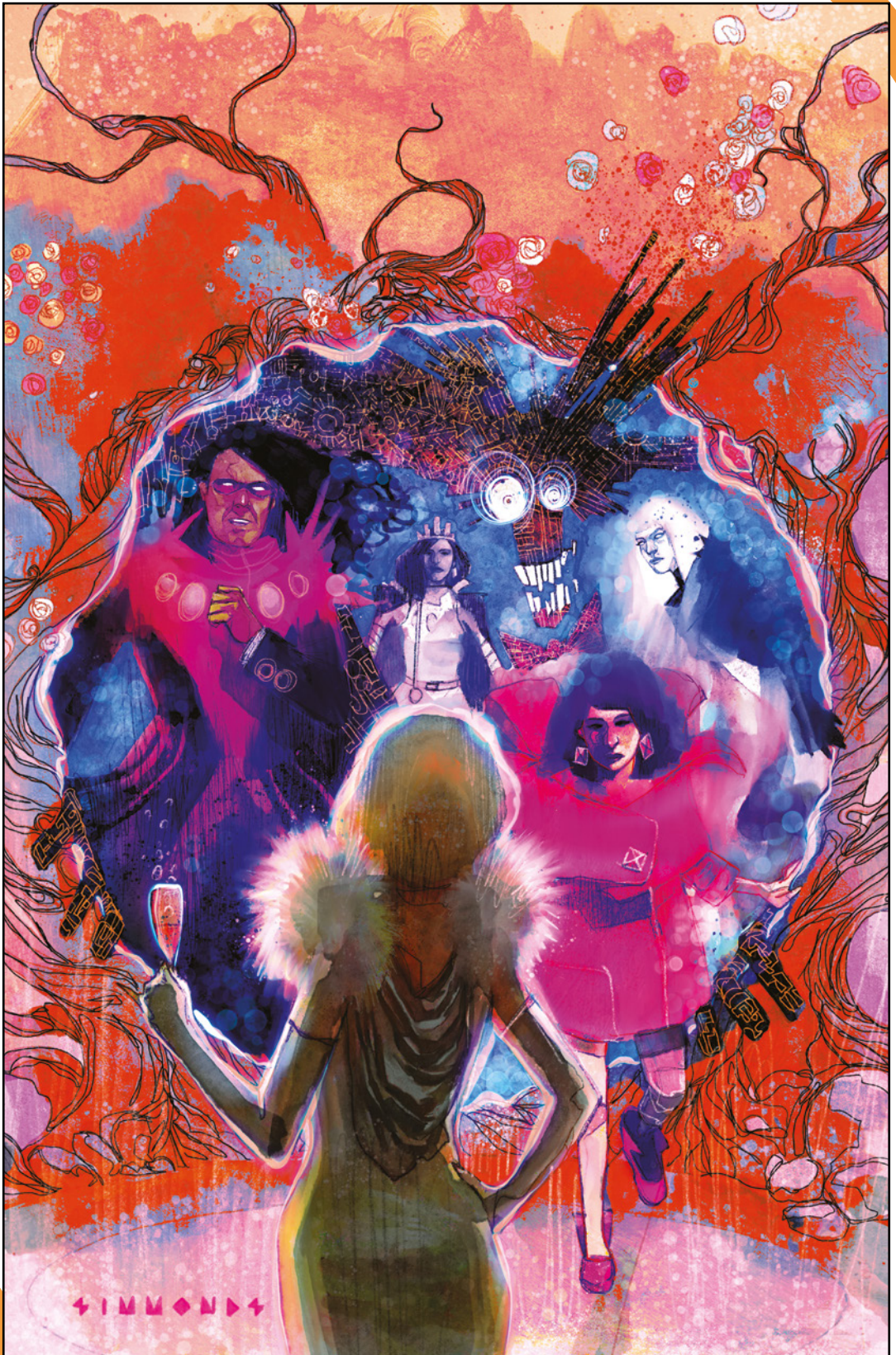
New Mutants (2019) 19 Cover von MARTIN SIMMONDS