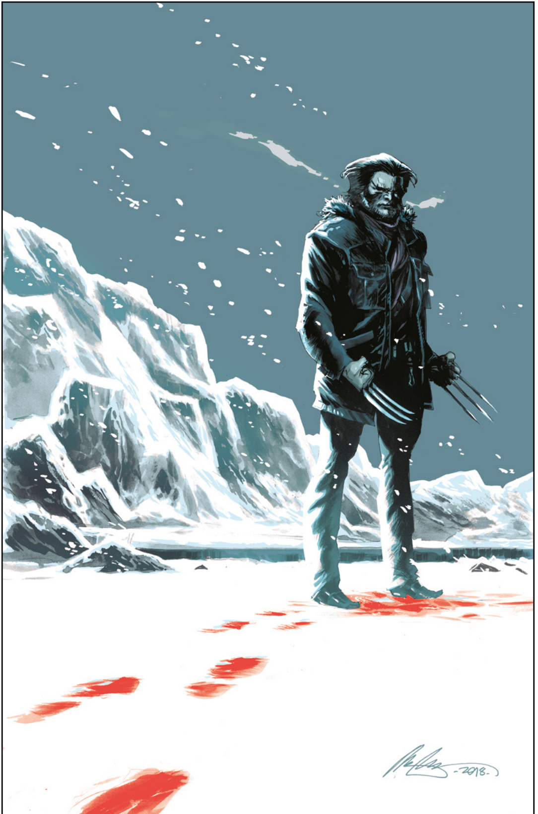
Wolverine: The Long Night Adaptation (2019) 1 Cover von RAFAEL ALBUQUERQUE