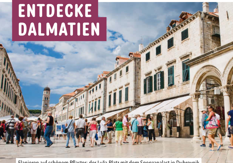
Flanieren auf schönem Pflaster: der Luža-Platz mit dem Sponzapalast in Dubrovnik

Eine Küstenlinie, die gar nicht zu enden scheint, tausend Inseln davor verstreut. Manche sind bewohnt, andere bloß raue Felsriffe. Zerklüftete Buchten und Strände, die Wellen rauschen, Städte aus weißem Stein – ein Traum! Dazu mediterran-lockeres Flair, Kulturschätze aus jeder Epoche – wen wundert's, dass Dalmatien eines der beliebtesten Urlaubsziele Europas ist.