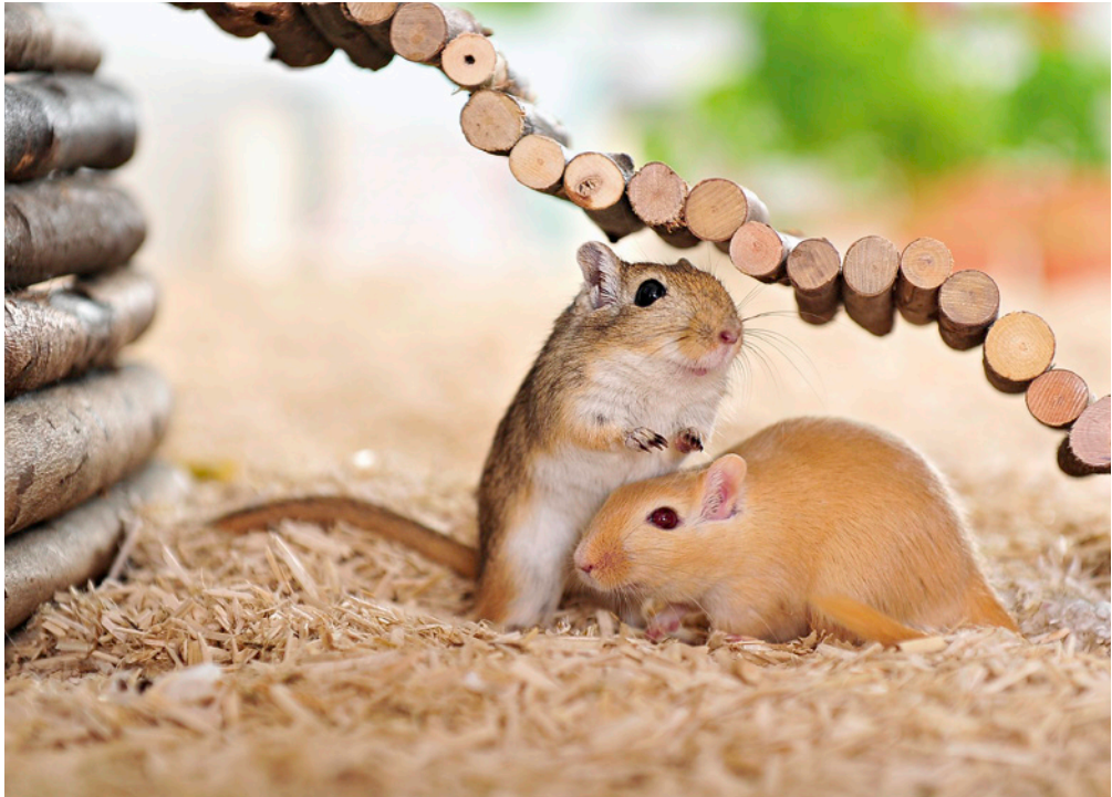
Rennmäuse Clever, neugierig und zutraulich

gestimmt sind. Rennmausbesitzer müssen sich daher gut mit den Tieren auskennen, um aus dem großen Sortiment für andere Nager das Richtige für ihre Tiere auszuwählen.