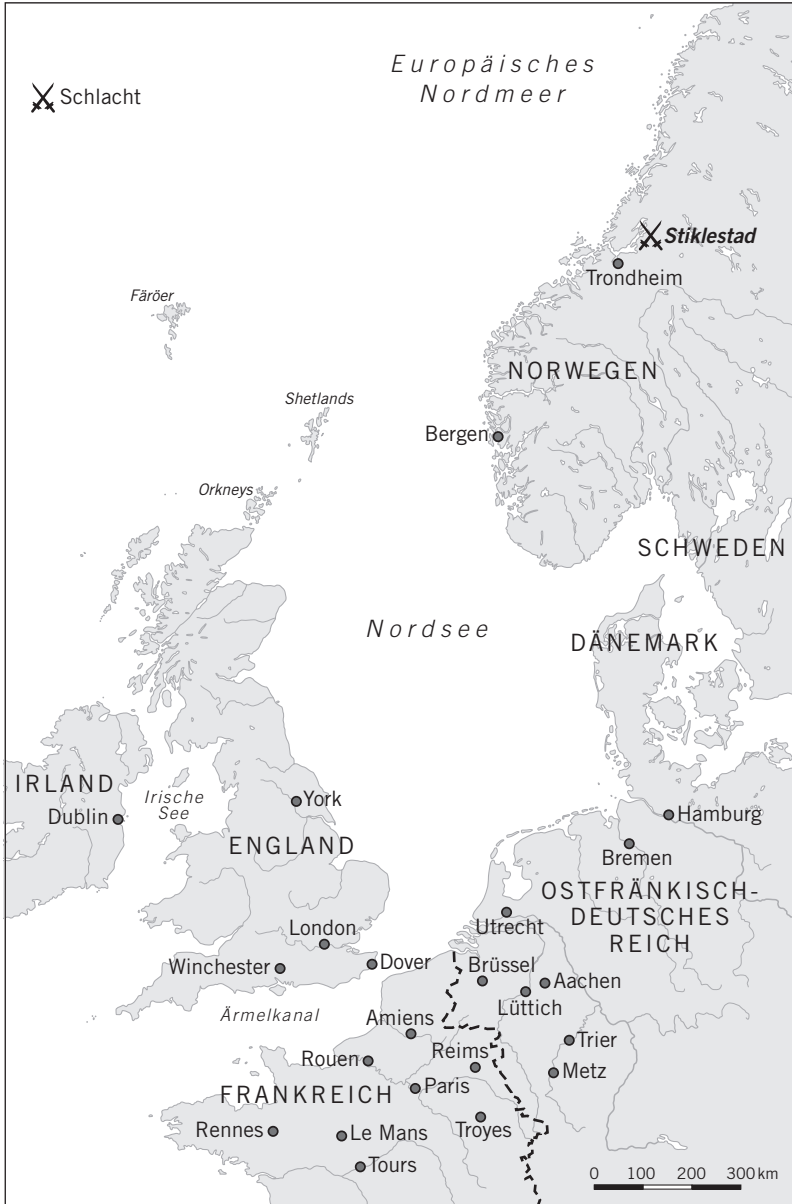
Karte 1 Der Nordseeraum