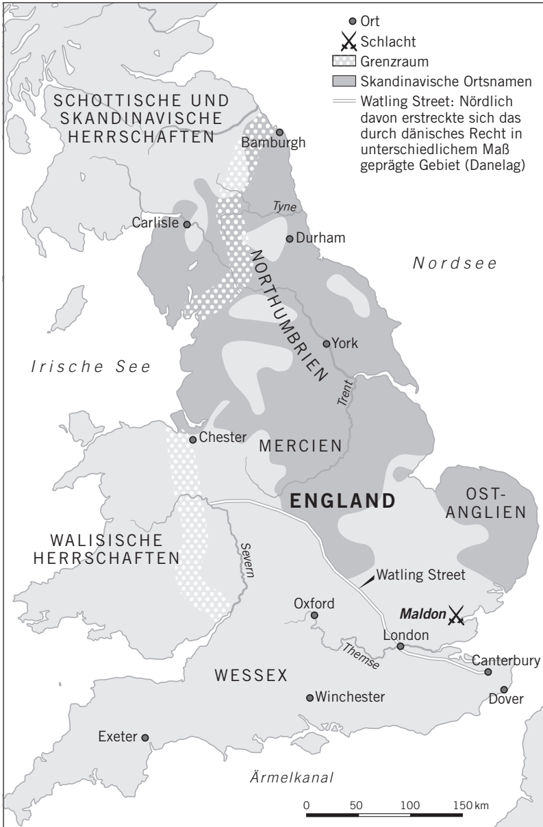
Karte 2 Großbritannien um 1000