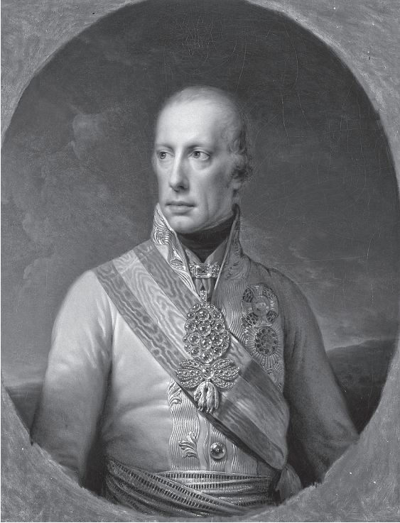
Franz II., Kaiser des Heiligen Römischen Reiches, der in der Aufklärung eine freimaurerische Verschwörung sah, mit der die Religion unterminiert und die Gesellschaftsordnung gestürzt werden sollte. Porträt von Johann Baptist Edler von Lampi, 1816.

Franz glaubte ehrlich, die Aufklärung sei ein Schwindel, vor dem seine unwissenden Untertanen geschützt werden müssten. Er fand Bildung an und für sich gefährlich und betrachtete jedes private philanthropische Engagement mit tiefem Misstrauen. Nach seiner Ansicht sollten die Menschen in niemandes Obhut als der ihres gottgegebenen Monarchen verharren. Wenige Tage nach der Thronbesteigung wies er die Polizei an, die Ausbreitung der «fanatischen Pseudo-Aufklärung» und aller anderen Ideen, welche die öffentliche Ordnung gefährdeten, unablässig und umfassend zu beobachten, denn dies sei die Hauptaufgabe des Staates. 16