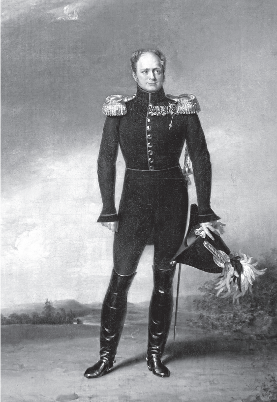
Zar Alexander I., der hoffte, dass eine von christlichen Prinzipien geleitete Regierung die von der Französischen Revolution entfesselten Kräfte des Bösen besiegen wird. Porträt von George Dawe.

vorbereitete, träumte er von einem geruhsamen Leben als Privatier irgendwo in Deutschland.