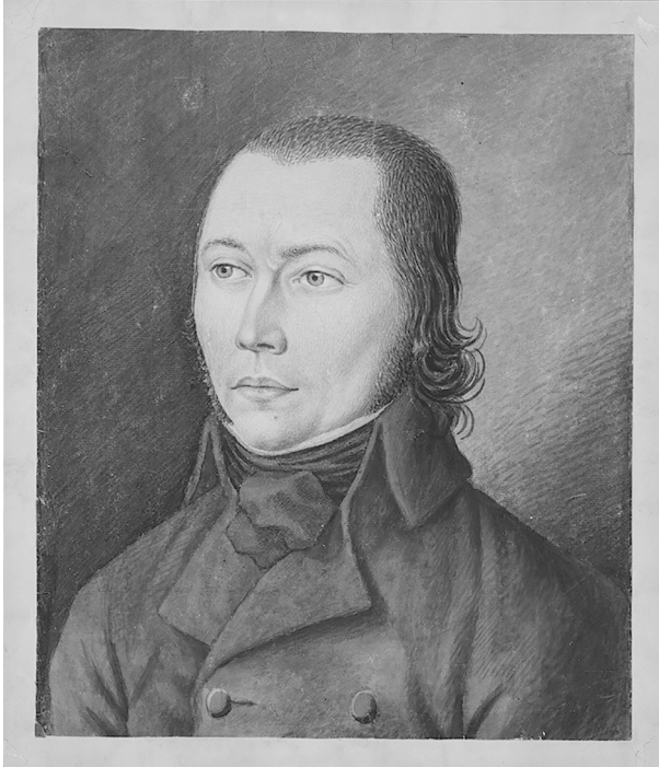
Abb 2: Johannes Bückler, genannt »Schinderhannes«, Portrait von Karl Mathias Ernst, 1803.

Kaum gesundheitlich genesen wechselte Schinderhannes im September 1799 auf die rechte Rheinseite, nachdem der Fahndungsdruck erhöht worden war. In der Nähe von Darmstadt lernte er bald seinen später treuesten Weggefährten kennen, den Christian Reinhardt, der als »Schwarzer Jonas« in die Kriminalgeschichte eingehen und am 21. November 1803 zusammen mit Schinderhannes unter dem Mainzer Fallbeil sterben sollte.