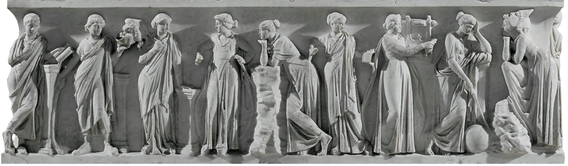
Die neun Musen auf einem Sarkophag aus dem 2. Jahrhundert (einige mit ihren Attributen dargestellt): Kalliope (epische Dichtung und Wissenschaft, Schriftrolle), Thalia (Komödie, lachende Theatermaske), Terpsichore (Chorlyrik und Tanz), Euterpe (Lyrik, Flöte), Polyhymnia (Gesang), Klio (Geschichtsschreibung, Schreibrille), Erato (Liebesdichtung, Leier), Urania (Astronomie, Himmelskugel und Zirkel), Melpomene (Tragödie, tragische Theatermaske)

einer Einzelperson vorgetragenen Lyrik Sapphos und Alkaios' gab es auch Chorlyrik, die jeweils von einer Gruppe einstudiert, gesungen und getanzt wurde. Einer ihrer prominenten Schöpfer war der griechische Dichter Pindaros (ca. 522–443 v. Chr.). Er feierte damit oft die Gewinner der damaligen sportlichen und künstlerischen Wettkämpfe, zu denen auch die Olympischen Spiele zählten. Die Spiele hatten eine rituell-religiöse Dimension, die in der Chorlyrik nachhallt. Ein weiterer Schauplatz der Chorlyrik war das griechische Drama (Tragödie, Komödie, Satyrspiel), bei dem ein singender und tanzender Chor das Geschehen kommentierte. Außer ein paar Fragmenten von Tragödien des Euripides (ca. 485–406 v. Chr.) hat sich aber kein einziger Ton der Einzel- und Chorlyrik erhalten. Was das Drama angeht, haben neuzeitliche Gattungen wie Oper, Oratorium oder Passion mit dem dort auftretenden Chor versucht, die Chorlyrik des antiken Dramas wiederaufleben zu lassen.