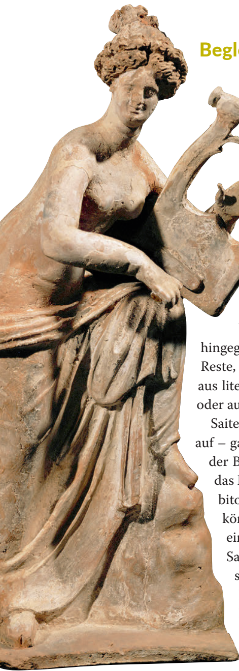
Musikantin mit Kithara, Tonstatuette aus Ägina, um 275 v. Chr.

Das Prinzip der Tonerzeugung mittels eines aus einem Rohrgewächs geschnittenen »Blattes«, daher der Name Rohrblatt-Instrument , hat sich bis heute erhalten. Die moderne Oboe verwendet wie der Aulos ein Doppelblatt, die Klarinette ein Einzelblatt.