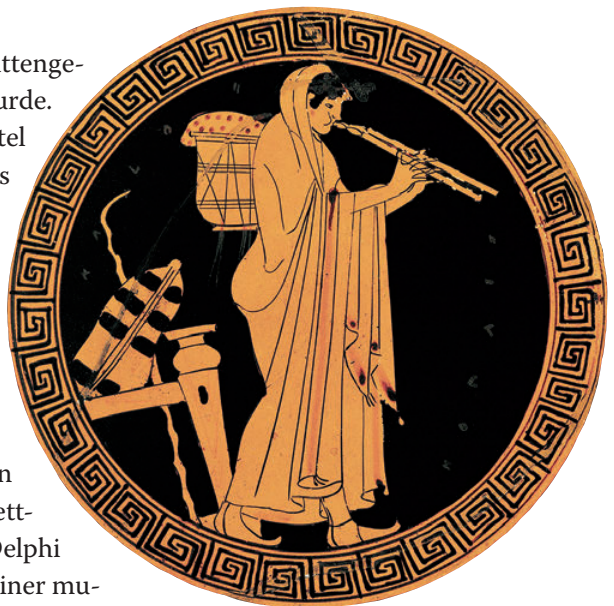
Aulosspieler, griechische Vasenmalerei, um 490 v. Chr.

Zu den Blasinstrumenten gehörte auch die »Hydraulis« genannte wassergetriebene Orgel. Sie wurde jedoch nicht mit den einzelnen Fingern, sondern aufgrund der Größe und Betätigungsweise der Tasten eher mit zwei Händen gespielt. Kleinere Versionen solcher Orgeln waren für den häuslichen Gebrauch bestimmt, größere wurden in Amphitheatern verwendet, um die Stimmung der Menge anzuheizen (die Heilige Katharina starb laut ihrer Märtyrerverlegende, »während die Orgel donnerte«). Die Orgel bildet vielleicht das Hauptbeispiel des Nachlebens antiker Musiktradition. Denn schon früh hat die Westkirche das Orgelspiel in den Gottesdienst eingeführt, wo es sich bis heute behauptet. Viel später waren die ersten Kinos mit Orgeln ausgestattet. Und sogar in amerikanischen Baseballstadien sind sie hin und wieder zu hören. Wie in den Amphitheatern der Antike also wird die Orgel heute noch verwendet, um Emotionen zu lenken und zu steigern. Die Umstände haben sich geändert, die Rolle der Musik ist dieselbe geblieben.