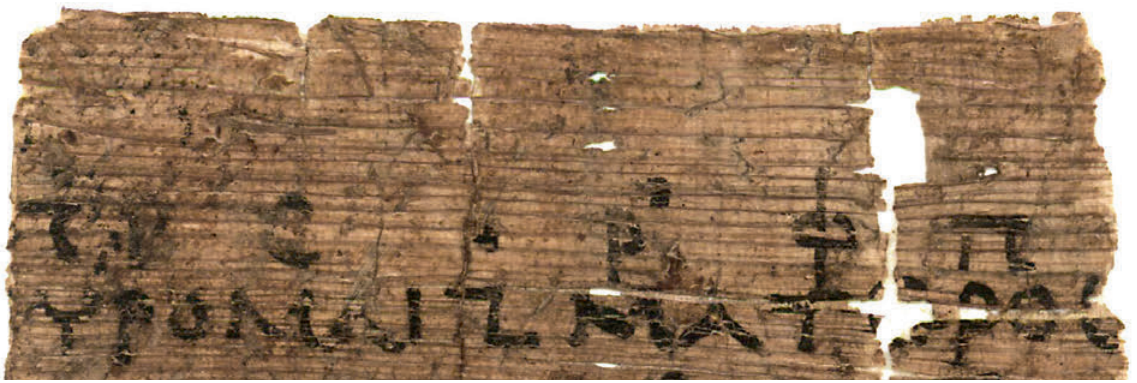
Detail aus dem Orestes -Fragment, Textausschnitt mit Tonzeichen wie im Notenbeispiel übertragen

Ein Tonos besteht aus mehreren Tetrachorden, die wiederum je drei Erscheinungsformen (Genera, von lateinisch »genus«: »Gattung«) aufweisen: diatonisch, chromatisch und enharmonisch. Wie bei den modernen Dur- und Moll-Tonleitern sind dabei gewisse Tonstufen veränderlich, wobei neben den uns bekannten Ganz- und Halbtönen im enharmonischen Genus auch Vierteltöne und andere Intervalle vorkommen.