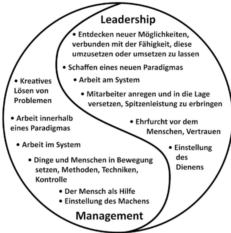
Abb. 2: Die Einheit von Management und Leadership im Yin-Yang-Modell (Hinterhuber 2003, S. 20)

In der Einheit von Yin & Yang gibt es keine klar definierte Grenze, da immer der Anteil des einen (Management) im anderen (Leadership) enthalten und keines ohne das andere möglich ist. Erfolgreiche Schulleitung lebt von starker Ausprägung beider. Die Unterschiede lassen sich aber verdeutlichen, wenn man sich die jeweiligen Charakteristika als Extreme denkt. So ist Management das kreative Lösen von Problemen, d. h. die Optimierung von etwas Bestehendem, etwa die kluge Organisation eines Vertretungsplans, wenn eine Lehrperson nicht an der Schule sein kann. Bei Leadership geht es um das Entdecken neuer Möglichkeiten, etwa das Erfinden einer Struktur, die das Fehlen einer Lehrperson gar nicht zum Problem macht, z. B. durch die Etablierung einer Teamstruktur.