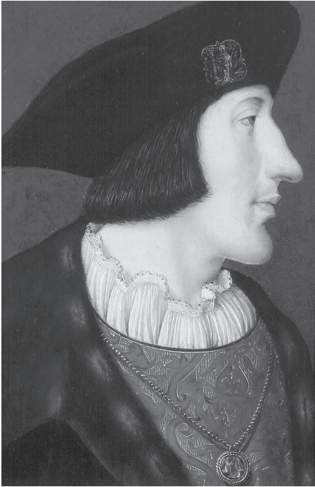
Herzog Karl III. von Savoyen. Das höfische Bildnis zeigt den ehemaligen Herrn Genfs mit anmutigen, fast feminin wirkenden Zügen. Die Genfer sahen ihn anders: machtbewusst, großsprecherisch und starrsinnig. Gemälde von Jean Clouet; Galleria Sabauda, Turin.

gesreisen von Genf entfernt. Ihm, Karl III. (beziehungsweise II. seines Namens, die Zählung differiert innerhalb der Dynastie selbst), gehörte nicht nur das Genf umschließende Gebiet einschließlich der Waadt im Norden, sondern auch das sogenannte vidomnat, die Stellvertretung des Bischofs in weltlichen Herrschaftsangelegenheiten. Dieses seiner Familie – einer der ältesten und vornehmsten innerhalb des schmalen Kreises der europäischen Hocharistokratie – seit Generationen zustehende Vorrecht wollte der Herzog zu einer faktischen Machtausübung ausdehnen. Damit drohte der Kommune an der Rhone das Schicksal, zu einer fürstlichen Landstadt und damit zum Objekt fremden Herrscherwillens herabgedrückt zu werden, eine für die urbanen Eliten der Zeit zutiefst abschreckende Vorstellung. Zu ausgeprägt war ihr Wille zur Selbstregierung ohne fremde Einmischung.