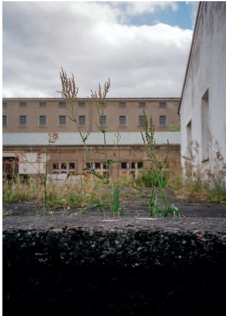
Rand eines Schwimmbeckens im ehemaligen Haftarbeitslager der Stasi in HSH. Im Hintergrund der Neubau des Haft- gefängnisses HSH. Berlin, 2017 Edge of a swim- ming pool in the former Stasi labor camp in HSH. Newer building of the HSH prison in the background. Berlin, 2017