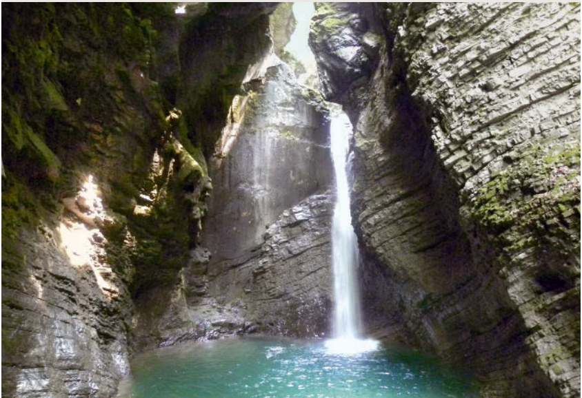
Überraschung in der Höhle: ein Wasserfall