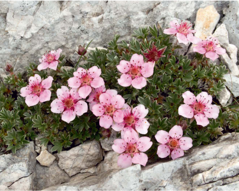
Aus Zlatorags Blut? Die Triglav-Rose, auch Dolomiten-Fingerkraut ( Potentilla nitida )

Schrotflinte und erklomm den Hang, auf dem Zlatorog weidete. Mit einem Schuss traf er den Bock, verwundet sank dieser zu Boden. Im Glauben, Zlatorog sei schwer verletzt, ging er auf das Tier zu. Doch der Gamsbock kaute bereits an den Rosen, die dem Blut entsprossen waren. Als sich der Jagdgeselle ihm näherte, erhob sich der Gamsbock und stieß ihn unerbittlich und mit aller Wucht in die Tiefe.