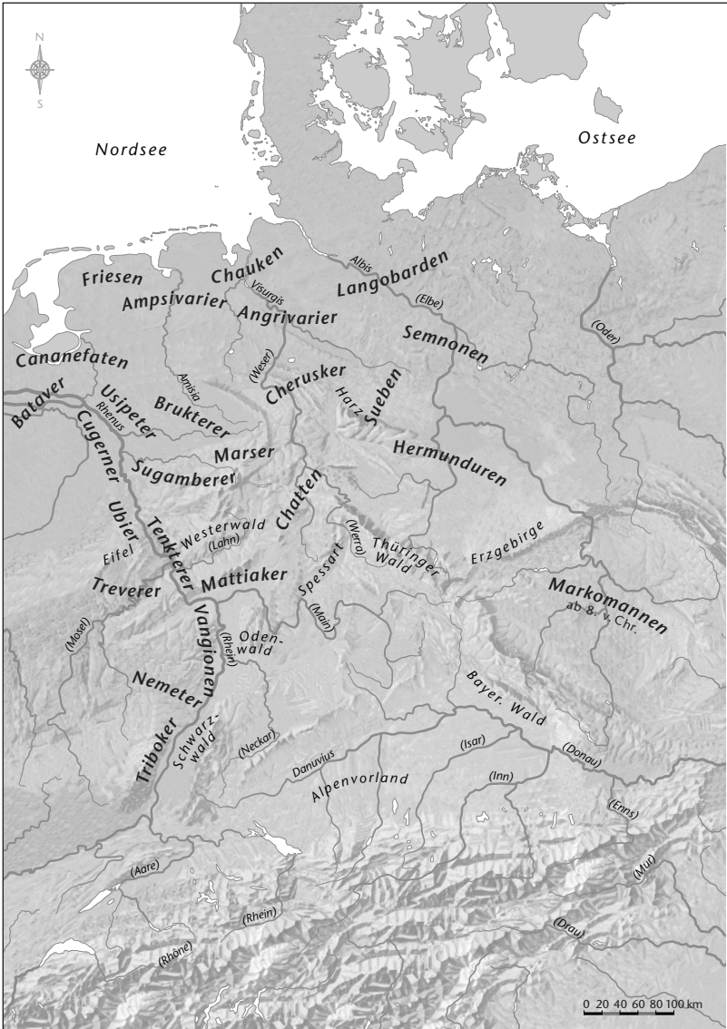
Abb. 1 Germanische Stämme und Stammesgebiete