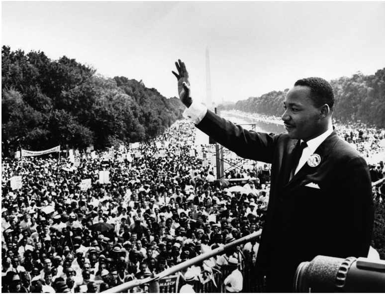
Abb. 1: Martin Luther King jr. während seiner Rede am 28. August 1963