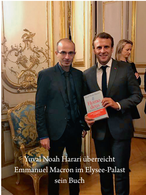
Yuval Noah Harari überreicht Emmanuel Macron im Elysee-Palast sein Buch

«Der Mann ist unverschämt begabt, unverschämt jung, Jahrgang 1976, schreibt glänzend und kann die anspruchsvollsten Themen mit leichter, stilistisch brillanter, unterhaltender Art zusammenfassen.»