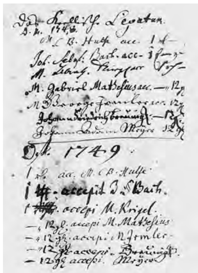
Quittungsbuch des Krellschen Legats, Eintragungen 1748/49

innerhalb des Jahres 1749 wird besonders gut erkennbar im Vergleich seiner Unterschrift von 1748 im Quittungsbuch des Krellschen Legats mit seinem ein Jahr später vorgenommenen Namenszug. Dieser deutet denn auch in die Richtung der ungelenkten und klobig wirkenden Einträge in der Originalpartitur der b -Moll-Messe, von denen die spätesten wohl erst im Winter 1749/50 vorgenommen wurden. Denn Bachs krankheitsbedingter Totalausfall begann nach jüngsten Erkenntnissen erst Mitte Mai des Todesjahres 1750. 3