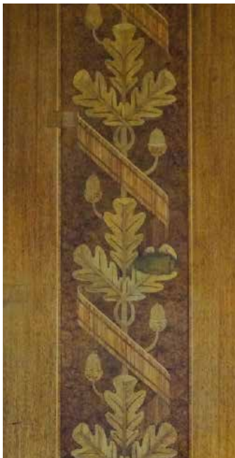
072po Abb.: mb