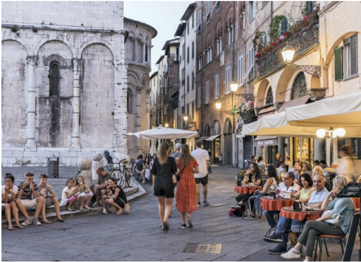
Heute so belebt wie vor 2000 Jahren: die Piazza San Michele in Foro. Hier finden nicht nur Märkte statt, auch spätnachmittags oder am frühen Abend ist das der Ort zum Bummeln und Genießen.

Rechteck der alten Römerstadt, geprägt. Die Via Fillungo gehörte dazu. Richtung Norden macht sie dann eine eher unrömische Kurve, das Castrum ist zu Ende. Es folgt rechter Hand eine gebogene Häuserreihe mit tunnelartigem Durchgang. Willkommen im Stadion der Antike, im einstigen Amphitheater! Doch oh Wunder: Ein heiterer, ovaler Platz voller Restaurants erwartet die Besucher. Nachdem die Zirkusspiele mit Gladiatoren und wilden Tieren aufgegeben waren, entstand ab dem frühen Mittelalter die kuriose Piazza Anfiteatro ③. Die Stadtbewohner bauten ihre Häuser sowohl auf den ruinösen Theatermauern als auch auf dem freien Platz. Den bereinigten Anblick von heute erhielt die alte Arena im 19. Jh., als Herzogin Maria Luisa von Bourbon einen großzügigen Marktplatz anlegen ließ.