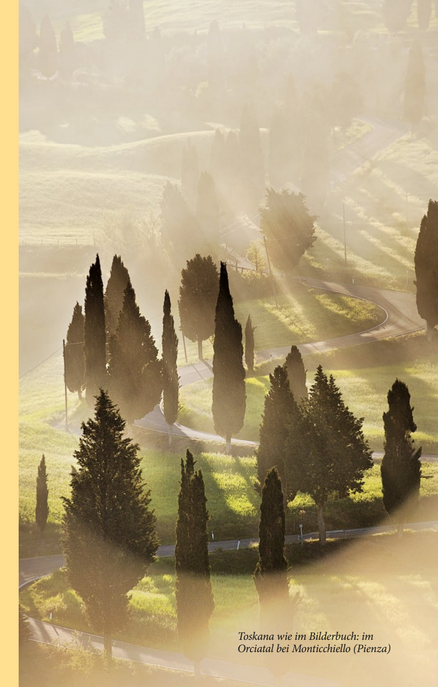
Toscana wie im Bilderbuch: im Orciatal bei Monticchiello (Pienza)