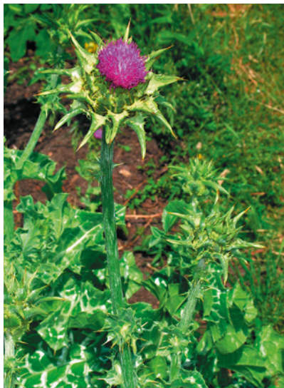
Mariendistel enthält Flavonoide.

Ursprünglich wurden als Flavone (lat. flavus = gelb) alle gelb färbenden Pflanzenstoffe mit den unterschiedlichsten chemischen Eigenschaften bezeichnet. Heute bezeichnet man nur noch all jene Stoffe als Flavonoide, die eine Phenylchroman-Grundstruktur aufweisen, unabhängig von ihrer Farbe. Sie sind im Pflanzenreich weit verbreitet und liegen meist glykosidisch gebunden in den oberirdischen Pflanzenteilen vor. Sie sind für die bunte Färbung der Blüten und Blätter verantwortlich. Manche Flavonoide wie das Rutin aus Rosskastaniensamen oder das Hesperidin in Zitrusfrüchten entfalten eine Schutzwirkung auf die Kapillarstrukturen im menschlichen Gewebe, wirken abdichtend und helfen bei einer abnormen „Brüchigkeit“ der Gefäße (Schutz vor freien Radikalen mit antioxidativer Wirkung). Indikationen sind so v. a. Herz-Kreislauf-Probleme und Störungen im Verdauungstrakt. Weitere Heilpflanzen mit hohem Flavonoidgehalt und einer Herzwirkung sind Weißdorn und Arnika. Eine Wirkung auf Leber und Galle hat die Mariendistel, die aufgrund ihres Silimarin-Komplexes zum Schutz der Leber eingesetzt wird. Krampflösend wirken die Flavonoide der Süßholzwurzel, harntreibend und auf den Nierenstoffwechsel harmonisierend wirken Birke, Hauhechel, Goldruten-Arten oder der Schachtelhalm. Auch Quercetin und Kämpferol sind therapeutisch wichtige Flavonoide. Ebenfalls