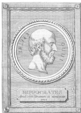
Mittelalterliches Bildnis des Hippokrates

Alle Völker der Erde hatten und haben ein reichhaltiges Wissen über die Heilwirkungen von Pflanzen. Dieses Wissen ist zum Teil uralt. So werden pflanzliche Mittel bereits in den sumerischen medizinischen Keilschrifttexten 3000–2400 v. Chr. erwähnt. Im alt-ägyptischen Kulturkreis gehen erste Aufzeichnungen über die heilende Wirkung von Pflanzen bis auf das Kahün-Papyrus 1900 v. Chr. zurück. Bereits in dieser Zeit sind auch die Wurzeln der Alchimie des Mittelalters zu finden. Aus dem griechisch-römischen Kulturkreis sind sehr viele Niederschriften über Medizin und Heilpflanzen erhalten, vor allem deswegen, weil die Texte durch das gesamte Altertum und das Mittelalter immer wieder von Mönchen abgeschrieben und so vor dem Verlust bewahrt wurden.