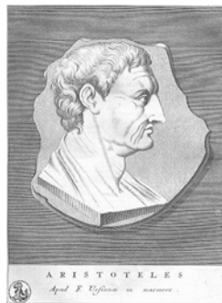
Mittelalterliches Bildnis des Aristoteles

Die Frage, was Krankheit eigentlich sei, tauchte auf und erste Theorien zur Krankheitsentstehung wurden entwickelt. Die Humoralpathologie, die zwar Hippokrates zugeschrieben wird, stammt vermutlich aus dieser Zeit. In