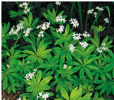
Waldmeister enthält Cumarin.