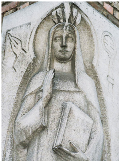
Hildegard von Bingen

Die Ursache von Krankheit ist für Hildegard in erster Linie ein gestörtes Verhältnis zu Gott, dass zu einem Missverhältnis zwischen Körper, Seele und Geist führt. Dadurch verschieben sich die vier Körpersäfte, die Hildegard „Phlegma“ (lat. = Schleim) nannte, und Krankheit entsteht. In Anlehnung an die Vier-Elemente-Lehre der Antike – wonach alles aus den vier Grundelementen Feuer, Wasser, Erde und Luft besteht – sind diese vier Säfte das „trockene Phlegma“ aus der Wärme des Feuers, das „feuchte Phlegma“ aus der Feuchtigkeit der Luft, das „schaumige Phlegma“ aus dem wässrigen Blut und das „lauwarme Phlegma“ aus dem erdenhaften Fleisch. Heilung ist für Hildegard ein ganzheitlicher Prozess, der sich gleichzeitig im religiösen, im kosmischen, im körperlichen und im seelischen Bereich vollziehen muss.