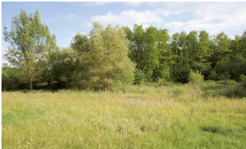
Wiesen und Bachläufe sind Standorte von Heilpflanzen wie Schafgarbe und Mädesüß.

Ganz am Schluss finden sich wichtige Hinweise, die, sollte es durch Fehlbestimmung oder falsche Anwendung einmal zu Vergiftungen kommen, eingehalten werden sollten.