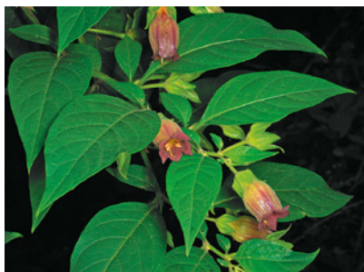
Tolliksche enthält Tropanalkaloide.

pflanzen in der Regel nicht als Teedrogen. Pflanzen mit Pyrrolizidinalkaloiden, z. B. Beinwell, Huflattich und Pestwurz, oder andere alkaloidhaltige Pflanzen wie Borretsch, Wasserhanf oder Kreuzkraut sollten nicht über einen längeren Zeitraum eingenommen oder für Einreibungen verwendet werden. Alkaloidreiche Pflanzenfamilien sind die Hahnenfußgewächse (z. B. Eisenhut und Rittersporn), die Liliengewächse (z. B. Weißer Germer und Herbst-Zeitlose), die Mohngewächse (z. B. Schlafmohn und Schöllkraut) und die Nachtschattengewächse (z. B. Bilsenkraut, Alraune und Stechapfel).