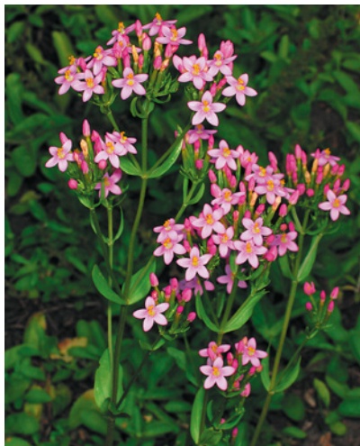
Tausendgüldenkraut enthält Bitterstoffe.

Amara acria: Diese Bittermittel enthalten Scharfstoffe und unterstützen daher nicht nur die Verdauung, sondern stabilisieren auch den Kreislauf, regen die Durchblutung der Gewebe an und wirken so entspannend. Meist sind Amara acria in fremdländischen Heilpflanzen wie Ingwer, Galgant und Pfeffer enthalten.