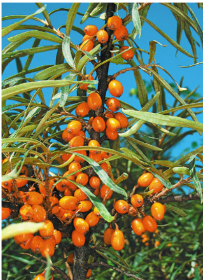
Sanddornfrüchte enthalten fette Öle.

Des Weiteren sind in fetten Ölen auch fettlösliche Vitamine wie die Carotinoide (Vitamin A) oder die Tocopherole (Vitamin E) sowie Phospholipide und Phytosterole enthalten. Meistens sind pflanzliche Öle aufgrund der hohen Gehalte an ungesättigten Fettsäuren flüssig. Den Pflanzen dienen die fetten Öle vor allem als Speichermedium im Samen und im Fruchtfleisch. Für den Menschen sind manche Fettsäuren essenziell, das bedeutet, sie müssen mit der Nahrung aufgenommen werden, da der Körper sie nicht selbst bilden kann. Die Linolsäure oder die Linolensäure beispielsweise dienen als Vorstufen der Prostaglandine. Da sie den Cholesterinspiegel im Blut senken, ist eine pflanzliche Kost mit vielen ungesättigten Fettsäuren besonders bei zu