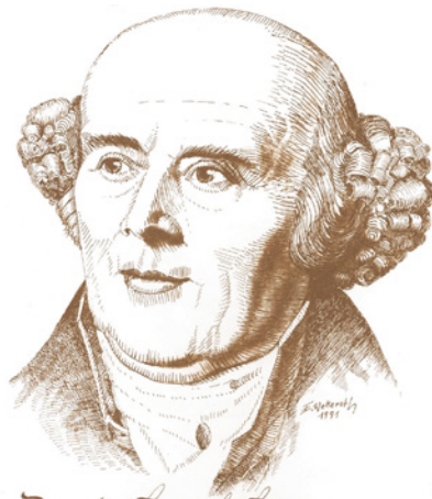
Dr. med. Samuel Hahnemann

Um Überreaktionen und Vergiftungen auszuschließen, begann Hahnemann, seine Substanzen zu verdünnen. Dabei entdeckte er, dass die Wirksamkeit nicht nur bestehen blieb, sondern sich sogar vervielfachte, wenn er eine bestimmte Vorgehensweise beim Verdünnen einhielt, die er Potenzieren nannte. Beim Potenzieren wird die Verdünnung nicht in einem Schritt hergestellt, sondern