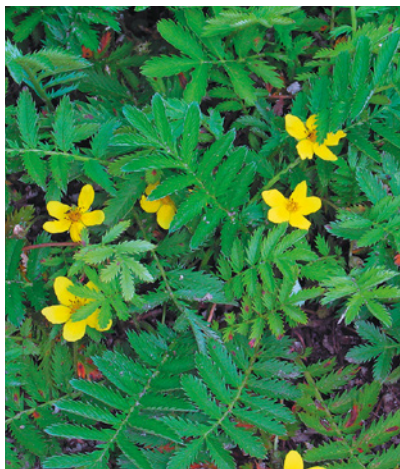
Gänsefingerkraut enthält Gerbstoffe.

Die Grundstruktur der Herzglykoside ist ein Steroidgerüst mit einem fünfgliedrigen (Cardenolide) oder sechsgliedrigen (Bufadienolide) Lactonring. Cardenolide sind z. B. in Fingerhut, Maiglöckchen und Adonisröschen enthalten, Bufadienolide in Meerzwiebel und Nieswurz. Insgesamt werden Heilpflanzen mit Herzglykosiden aber aufgrund einer möglichen (giftigen) Überdosierung selten eingesetzt, synthetische Arzneistoffe haben sie ersetzt.