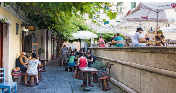
Einer von vielen Treffpunkten in Piran

pršut , den leckeren Schinken, nicht entgehen lassen: Nur Fleisch vom Jungschwein, das weniger als 125 kg wiegt, darf zu seiner Herstellung verwendet werden. Einen Monat lang wird es in eine Lake mit Meersalz, Knoblauch und Kräutern eingelegt, anschließend in Räumen aufgehängt, durch die der scharfe Bora-Wind pfeift. Nach etwa einem Jahr ist es so weit: Das ausgedörrte Fleisch wird in hauchdünne Scheiben geschnitten und mit pikant eingelegten Oliven und Steinofenbrot serviert. An der Küste regiert mediterrane Kost. Auf der Speisekarte wird Fisch in vielen Varianten angeboten, häufig auch gratinierte Cannelloni, Risotti und