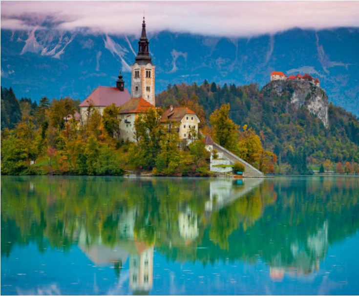
Eine Postkartenschönheit: der See von Bled mit Kircheninsel und Klippenburg, im Hintergrund die Karawanken

20 km lang. Spektakulär sind vor allem die Höhlen von Škocjan (Škocjanske Jame) und die Adelsberger Grotte (Postojnska Jama, ☞ C 6).