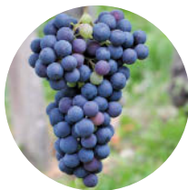
Roter Teranwein wird vor allem an der Küste getrunken.

sind auch die in den Gaststätten aufgetischten Schnäpse und Liköre. Zur Verdauung geeignet sind würziger Wacholder- und Kräuterschnaps ( brinovec/lušterk ), milder sind Birnenschnaps ( viljemovka ) und süßer Traubenlikör ( radgonska ranina ).