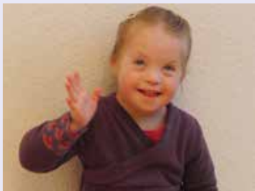
Abb. 1: Hallo (winken)

Das Thema „Gebärden“ gewinnt in den letzten Jahren (nicht nur) in der Unterstützten Kommunikation (UK) immer mehr an Bedeutung. Das hat verschiedene Gründe: