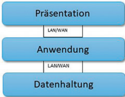
Bild 1.3 3-Schichten-Modell

verbindung werden sie erreicht? Daran lässt sich ablesen, welche Bedeutung Breitbandnetzen zukommt.