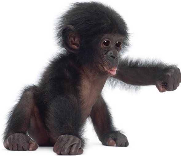
Abb. 1.4 Verwandter. Ein junger Bonobo. Die genetische Verwandtschaft von Schimpansen, Bonobos und Gorillas mit dem Menschen ist sehr hoch. Aber bei rund 2 % Abweichung gibt es immerhin ca. 60 Millionen genetische Unterschiede. Dazu kommen noch mehr Unterschiede in der Genregulierung und Entwicklung

einem gewaltigen evolutionären Sprung aus, musste doch dafür zuerst die Plazenta, also die Schnittstelle, die die Mutter mit dem Embryo verbindet, entstehen. Sie versorgt das junge Leben mit Nährstoffen und Sauerstoff aus dem mütterlichen Blutkreislauf. Eine solche Plazenta kann – sollte man denken – entweder vorhanden sein oder nicht. Wie, bitteschön, soll ein schrittweiser, kumulativer Prozess für ihr Entstehen aussehen? Hundert oder mehr Einzelschritte, bevor sie funktionsfähig ist? Tatsächlich existiert heute nicht nur eine Theorie, wie die Plazenta bei den Säugetieren entstanden sein könnte, etwa durch eine virale Invasion (Retroviren) der Keimzellen (Onoa et al. 2001). Allzu kompliziert kann es wiederum nicht gewesen sein, gibt es doch zahlreiche Fische, unter ihnen Haie, die lebend, und andere, die nicht lebend gebären. Mussten aber bei den Säugetieren nicht gleichzeitig mit der Plazenta auch die mütterlichen Milchdrüsen entstehen? Diese können wir uns doch ebenso nur als vorhanden oder nicht vorhanden vorstellen. Die Milch fließt oder sie fließt nicht. In der Tat eine ziemlich verzwickte Koordinationsaufgabe für eine Evolution, die kein Ziel kennt und in kleinen Schritten voranschreitet. Über den Sprung von einem Herz mit drei getrennten Kammern (Amphibien und Reptilien) zu einem Herz mit vier Kammern (Vögel und Säugetiere) will ich mich gar nicht erst auslassen: drei oder vier? Dreieinhalb oder gar 3,6 Kammern mit den passenden Zu- und