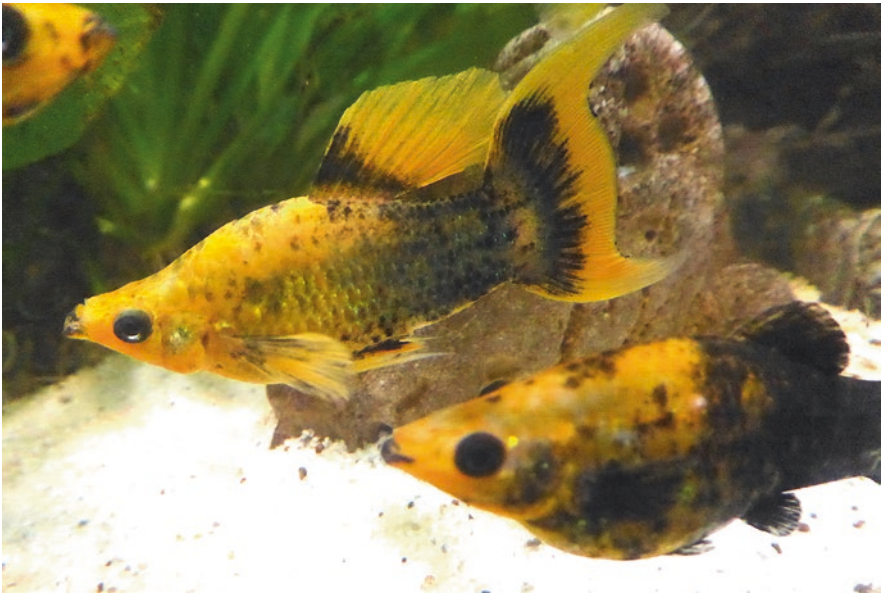
Abb. 1.1 Angeberfisch. Darwin orientierte sich stark an Züchtungen, als er seine Theorie entwickelte. Aus künstlicher Selektion leitete er die Wirkung der natürlichen Selektion ab. Hier ein Prachtexemplar eines Mollys ( Poecilia sphenops ). Die außergewöhnlich vergrößerte Schwanz- und Rückenflosse entstehen in heutigen Zuchtbetrieben durch natürliche Spontanmutationen und menschliches Auskreuzen. Bei den wildlebenden Populationen hat der Schwanz eine konstante, angepasste Größe und Form, da auf ihn als Hauptantriebsflosse starke natürliche Selektionskräfte wirken. Eine Ausnahme sind die Männchen des verwandten Schwertträgers ( Xiphophorus hellerii ), den Darwin bereits beschrieb. Im Aquarium, in dem die natürliche Selektion ausbleibt, kann die sexuelle Selektion stärker wirken. So können – wie im Bild – bei einem Männchen schon einmal auffällige, sekundäre Sexualmerkmale entstehen, die bei den Weibchen gut ankommen

Ein paar Antworten auf essenzielle Fragen bleibt uns Darwin freilich schuldig. Man darf sagen, dass sein Buch zwei große Lücken enthält, auf die schon sehr früh aufmerksam wurde. Wir vermissen das Wie der Vererbung und das Woher der Variation. Natürlich hatte sich Darwin zur Vererbung