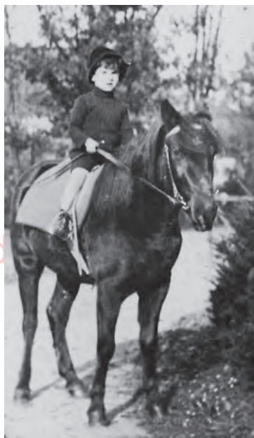
Helmut James von Moltke, um 1912

lernte er reiten, kutschieren und schießen. Von hier aus wurden Tagesritte und Autofahrten in die weitere Umgebung unternommen. Hier half er wie die anderen Schuljungen gegen Entgelt bei der Ernte und beim Heueinfahren. Hier ging er zum Konfirmandenunterricht beim Gräditzer Pfarrer, mit dem er «stets große Disputationen» führte.