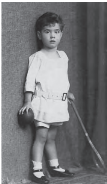
Helmut James von Moltke, um 1911