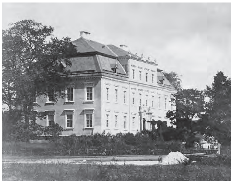
Schloss Creisau, um 1895

Generalfeldmarschall Helmuth von Moltke (1800–1891), der Urgroßonkel Helmuth James von Moltkes