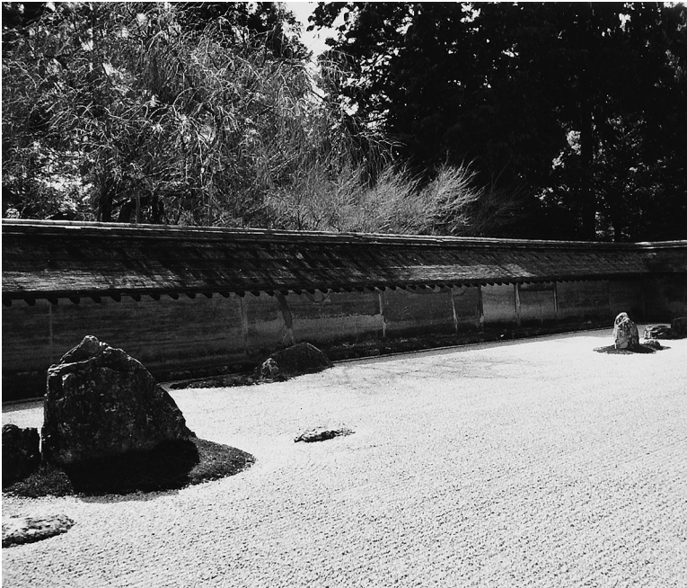
Abb. 1: Der Steingarten des Ryōanji in Kyoto (Teilsicht)

Ryōanji ist auf dem Weg zur Erforschung der Kultur ein guter Orientierungspunkt, denn er erinnert uns an die Grenzen der eigenen Beobachtung, und sorgfältiges Beobachten ist lediglich der Anfang der Untersuchung.