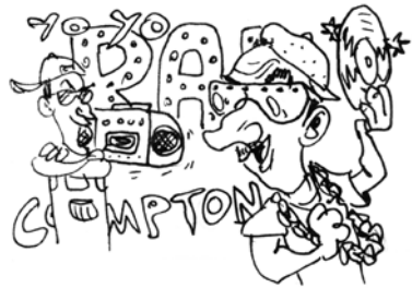
DER OLDSCHOOL RAP-PRESENTER