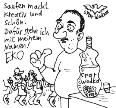
WERBUNG FÜR RANDOM PRODUKT, UM ALBUMVERLUSTE WIEDER REINZUHOLEN