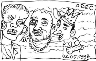
17000 BARS KARRIERE RÜCKBLENDE