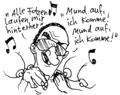
DER PROVOKANTE TRACK