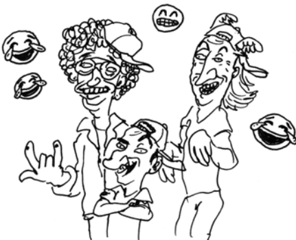
DAS SPAß-FEATURE MIT DEUTSCHEM SAT1/YOUTUBE COMEDIAN