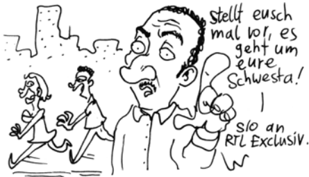
DER ERNSTE SONG ÜBER DIE TRAGISCHEN GESCHEHNISSE VORIGER WOCHE