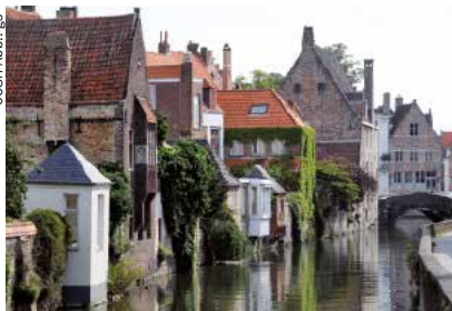
☒ Wohnen am Wasser: in Brügge nichts Ungewöhnliches