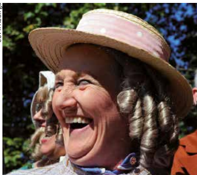
☒ Eine Gentearin hat sich gut gelaunt in ein historisches Kostüm geworfen

Nach dem Frühstück ist es nur eine knappe Auto- oder Eisenbahnstunde nach Gent, das auf dem Weg nach Antwerpen liegt. Kunstfreunde steuern am besten gleich die beiden Museen im Süden der Stadt an, das Städtische Museum für zeitgenössi-