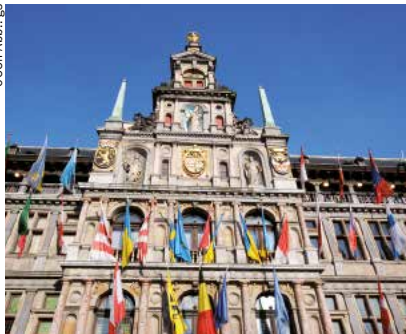
☒ Das bunt geschmückte Rathaus in Antwerpen