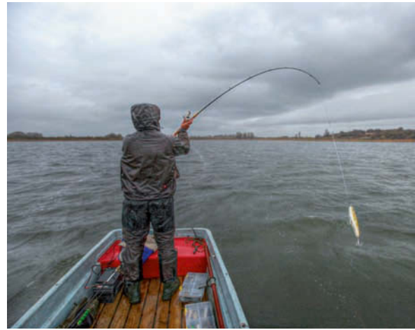
Schietwetter ist Fangwetter! Nicht immer geht Hechtangeln gemütlich zu.

Nun wird es doch noch kompliziert, denn es gibt natürlich keine Regel ohne Ausnahme. In der kalten Jahreszeit dreht die Theorie ins Gegenteil, sobald es sich um einen kalten Wind handelt. Jetzt, bei eiskaltem Wasser, animiert schon eine kleine Temperaturerhöhung die Fische zum Fressen. Wer jetzt im kalten Wind fischt, ist selten erfolgreich, schließlich ist auf der windabgewandten Seite das Wasser ein kleines bisschen wärmer. Dies ist übrigens häufig auch der Grund, warum viele Angler sagen, dass bei Ostwind die Fische schlecht beißen. Denn: Häufig kommt aus östlichen Richtungen ein kalter Wind. Vermutlich ist gar nicht die Windrichtung, sondern lediglich die Temperatur für verschlossene Hechtmäuler verantwortlich. Und überhaupt: Wer wird schon auf seinen lange geplanten Hecht-Angeltrip verzichten, nur weil der Wind aus der vermeintlich falschen Richtung bläst? Eben, ich auch nicht!