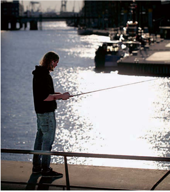
Hafeneinfahrten und -becken sind ganz hervorragende Zanderspots.