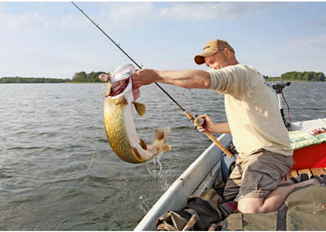
Hab dich! Hier hat sich Gewässerkenntnis in Form eines schönen Fangs ausgezahlt.

trieben werden. Denen folgt der Kleinfisch, der Räuber ist dann nicht mehr weit entfernt. Grundsätzlich gilt: auf der windzugewandten Seite die Angel auswerfen. Hier ist zusätzlich der Sauerstoffanteil im Wasser höher (besonders wichtig im Sommer), außerdem scheinen Fische sich unter einer wellenbewegten Wasseroberfläche wohler zu fühlen.