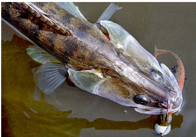
Angetrübtes Wasser erleichtert das Angeln auf Zander.

nen Abnehmer. Es gibt aber auch Ausnahmen und Eigenarten, die für das genaue Gegenteil sprechen. Eben schon angesprochen: Wenn die Nacht hereinbricht, verlieren Zander ihre Scheu und jagen wie Berserker den Kleinfischen nach, die sich im flachen Uferbereich und an der Wasseroberfläche tummeln. Als würden Apfelsinen ins Wasser geworfen werden, spritzt und platscht es, wenn die Zander auf Drehzahl kommen und in die Kleinfischschwärme schießen. Von wegen Zander sind Zicken! Heute Nacht nicht! Klassische Köder versagen jetzt kläglich. Flach laufende Wobb-