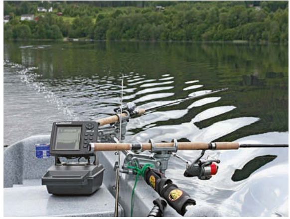
Hechte fangen, heißt Hechte suchen! Echolote sind längst erschwinglich geworden und helfen ungemein.

chen Unterwasserstraßen auf die Lauer zu legen. Und das häufig sogar in größeren Trupps! Vergessen Sie alles, was Ihnen andere Leute darüber erzählen, dass Hechte Einzelgänger sind. Papperlerpapp! Wer einmal fünf, sechs Hechte innerhalb kürzester Zeit an einer Stelle gefangen hat, weiß, dass da nichts dran ist.