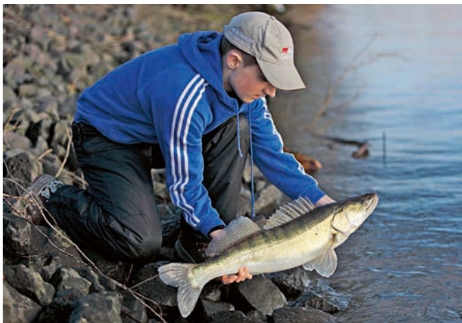
Dicht an der Steinpackung schnappte sich der Zander den Köder – typisch!

Wie bei allen Raubfischen gilt beim Zander natürlich auch die Regel, dass sie sich in der Nähe ihrer Beutefische aufhalten. Allerdings: Zander ernähren sich nicht nur von Gräten-, sondern auch von Krustentieren wie Krebsen und Krabben. Die sind eigentlich immer in Grundnähe zu finden, deshalb findet unser dort angebotener Köder ziemlich sicher sei-