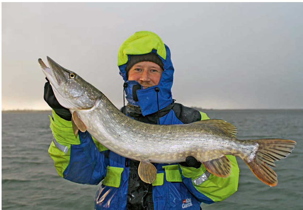
Brrr, ist das kalt! Selbst bei Minusgraden lassen sich Hechte zum Biss überreden.

mehr in das Freiwasser zurück. Hier wird die Sache mit der Wassertemperatur noch einmal richtig interessant. Das Stichwort lautet: Sprungschicht! Die ist in tiefen Gewässern entscheidend für den Aufenthaltsort der Fische und bildet sich in der warmen Jahreszeit zwischen der kalten Tiefen- und der warmen Oberschicht des Gewässers. Warum das so ist? Weil Wasser – je nach Temperatur – eine andere Dichte hat und sich deshalb nicht gleichmäßig vermischt, sondern in unterschiedliche Ebenen aufteilt. In der mittleren Ebene, der Sprungschicht, fühlen sich Hechte deutlich wohler, als in der viel zu warmen Schicht darüber oder im deutlich kühleren und sauerstoffärmeren Tiefenwasser. In der Regel bildet sich die Sprungschicht in sechs bis 15 Metern Tiefe aus. Wer die volle Sendeleistung an seinem Echolot einstellt (und die Fischsymboleinstel-