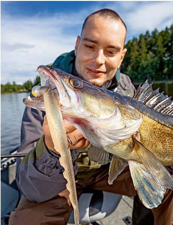
XL-Köder direkt unterm Boot angeboten – so werden seit einigen Jahren Freiwasser-Zander befischt.

ler sind nun erste Wahl. Seit einigen Jahren ist ein kleiner Boom dieser Zanderangelei entstanden, der alles bisher geglaubte („Zander fressen am Grund, basta!“) gehörig widerlegt. Zweiter Beweis, dass Zander alles andere als reine Grundfresser sind, ist das ebenfalls stark in Mode gekommene Vertikalangeln im Freiwasser. Dabei werden mittels Echolot Einzel-fische im Mittelwasser gesucht und dann mit Gummiködern in XL-Größe gezielt beangelt. Während kleinere Zander unter 60 Zentimetern Länge bei dieser technisch aufwändigen Methode fast nie gefangen werden, fielen in den letzten Jahren gleich reihenweise Größenrekorde. Mehr dazu lesen Sie ab Seite 152. Aber um uns zu beruhigen: Viele, viele Zander werden heute und auch noch in 20 Jahren am Grund gefangen.