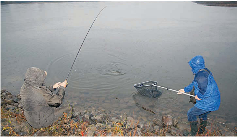
Gleich ist er im Kescher – der Flussbecht schnappte sich den Gummifisch im Bubnenkessel.