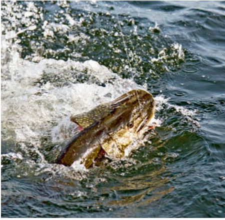
Einzelgänger Hecht? Einer von mehreren Fischen, die an der gleichen Stelle bissen.