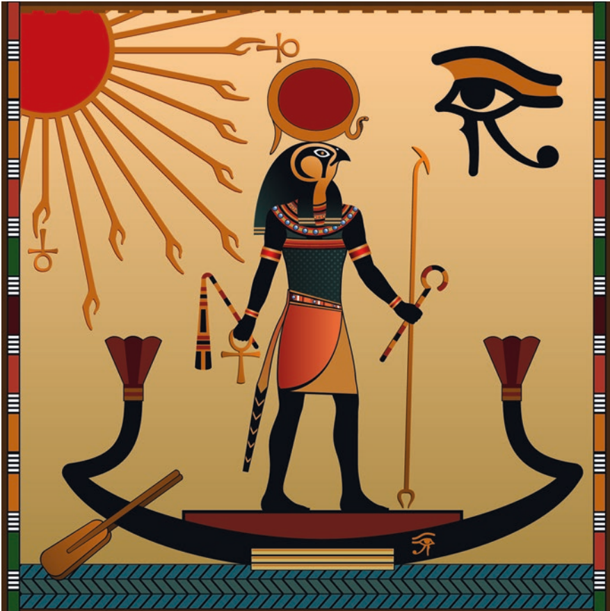
Abb. 1.1 Ägyptische Malerei: Darstellung der Reise der Sonnenbarke unter den Strahlen des Sonnengotts.