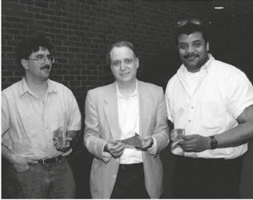
Abbildung 1: Die drei Autoren, von links nach rechts: Strauss, Gott und Tyson.

Nachdem wir den Kurs einige Jahre lang gegeben hatten, beschlossen wir, diese Ideen für Leser, die es nach einem tieferen Verständnis des Universums verlangte, in Form eines Buches niederzulegen.