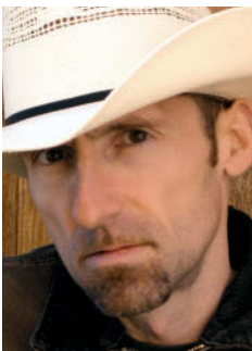
Der Fotograf Christian Heeb lebt in Bend/Oregon, im Nordwesten der USA. Nach Kalifornien führten ihn schon wiederholt intensive Fotoproduktionen.

„Und allein schon San Francisco, die Stadt am Golden Gate, ist ein wahres Sehnsuchtsziel.“