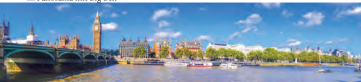
Panorama mit Big Ben

Wenn Sie sich um eine sorgfältige Aussprache bemühen möchten, dann achten Sie darauf, stimmhafte Mitlaute am Wortende anders als im Deutschen wirklich stimmhaft auszusprechen. Also bed = bedd , nicht wie bet = bett .