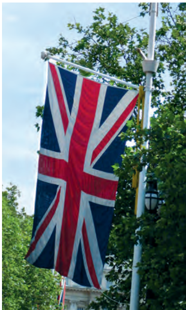
Union Jack, Flagge des United Kingdom