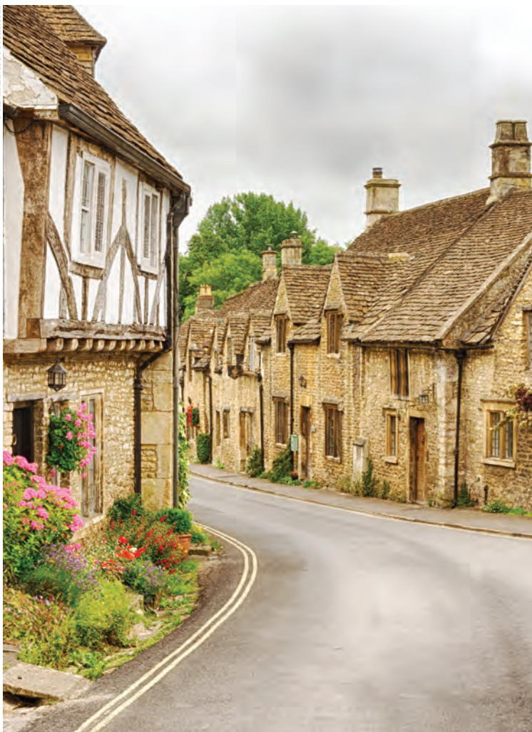
Das malerische Dorf Castle Combe in Wiltshire