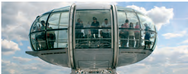
Kabine des London Eye