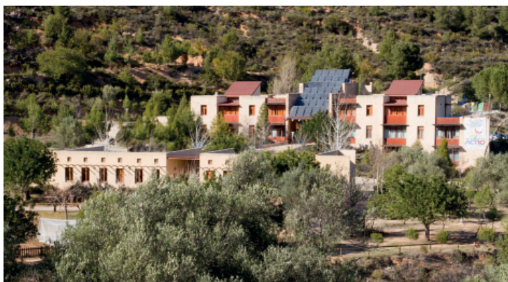
COMPLEJO ECOLÓGICO ACTIO. GREENPEACE