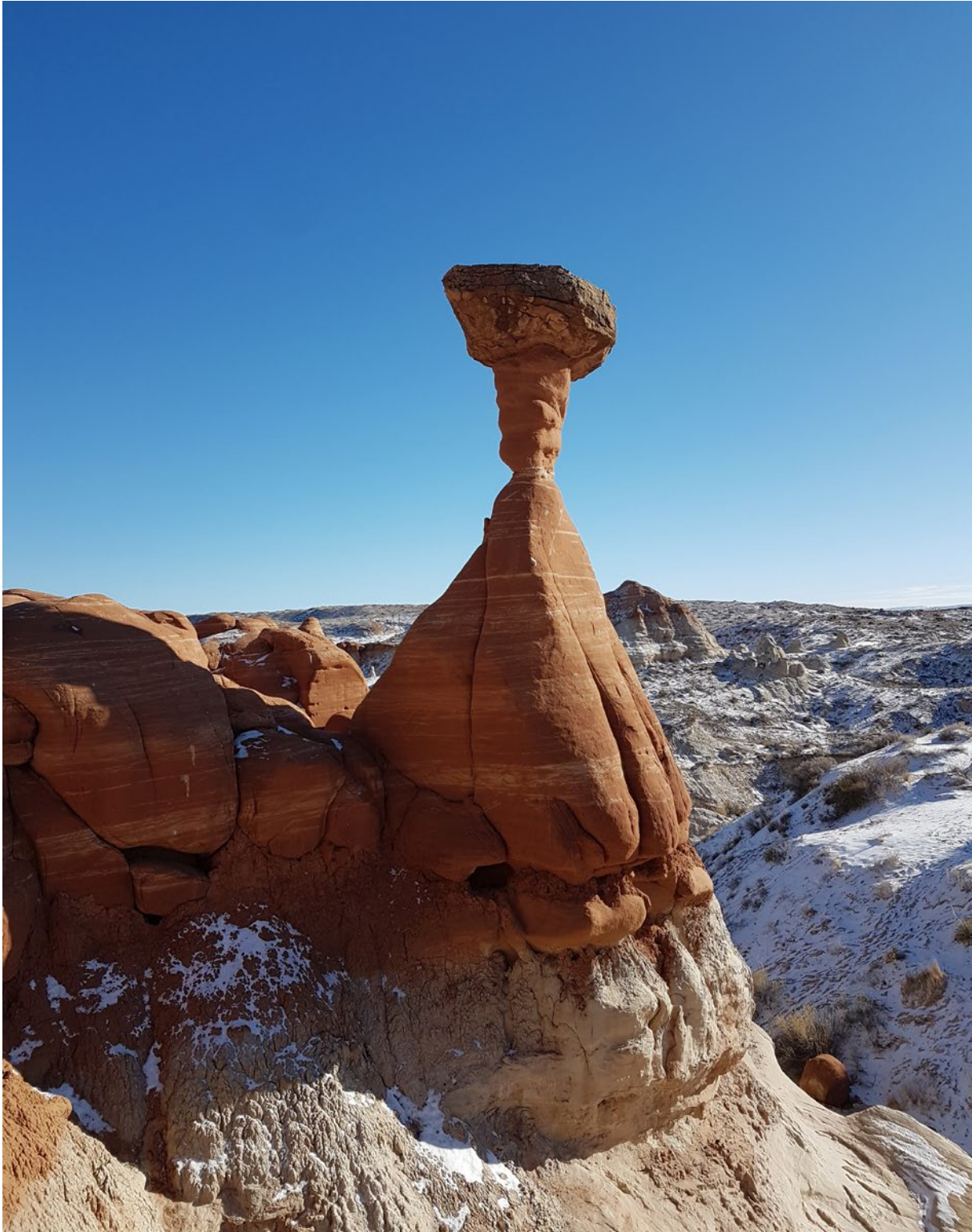
Impressionen aus den USA.