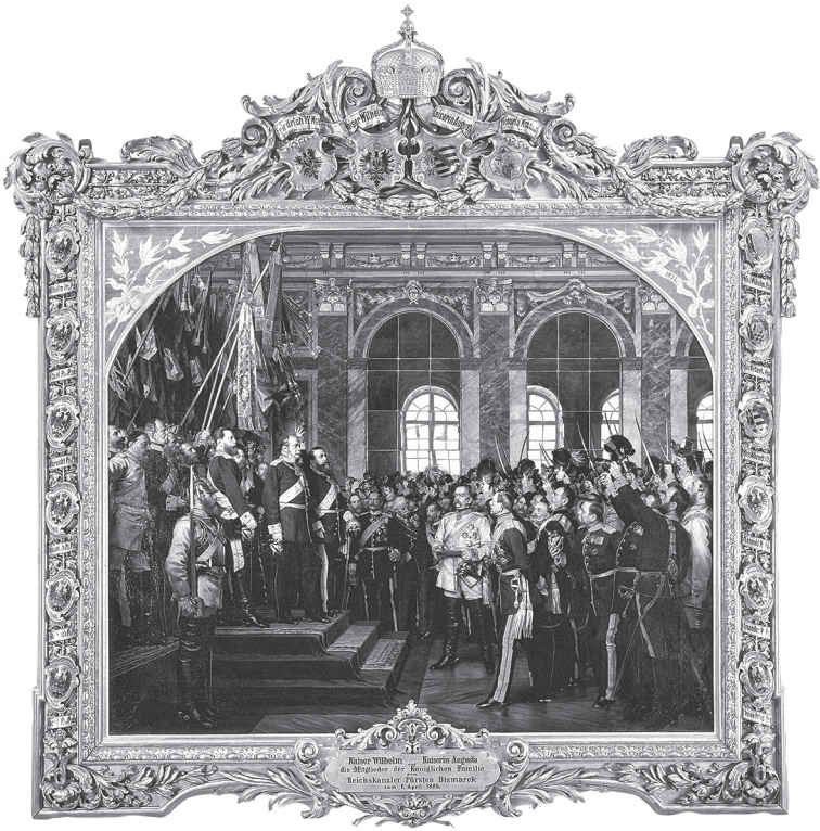
Abb. 1: Die «Kaiserproklamation» am 18. 1. 1871, gemalt von Anton von Werner: Ein Propagandabild prägt das Geschichtsbewusstsein. Was wird gezeigt, was nicht, wer fehlt?

Von Werners Gemälde lieferte die Bildikone der Reichsgründungszeit. Otto von Bismarcks donnernde Worte aus seiner ersten Rede als preußischer Ministerpräsident am 30. September 1862 vor der Budgetkommission des preußischen Abgeordnetenhauses sind so etwas wie die Sprachikone dieser Zeit. Nicht durch Reden würden «die großen Fragen der Zeit entschieden», hatte er den Abgeordneten entgegengeschleudert, «sondern durch Eisen und Blut». Schon die Zeitgenossen machten daraus häufig «Blut und Eisen», und heute ist diese sprachlich