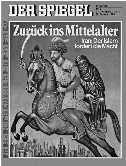
«Zurück ins Mittelalter»: «Der Spiegel» Nr. 7 vom 12. Februar 1979 deutet die Iranische Revolution als Rückkehr in ein nie ganz überwundenes islamisches Mittelalter.

Hier sind alle Klischees beieinander: Das Mittelalter ist das Gegenteil von Fortschritt. Es ist alles sehr religiös, und eine Trennung von Religion und weltlicher Macht gibt es nicht. Das stimmt zwar historisch nicht, aber mit dem Mittelalter ist ja auch keine reale Epoche gemeint, sondern ein überzeitliches Phänomen der Rückständigkeit und des religiösen Fanatismus. Deshalb können zum Beispiel auch die USA zurück ins Mittelalter, obwohl es, wie selbst die eifrigsten Verfechter des Begriffs nicht leugnen werden, zumindest in den USA kein Mittelalter gegeben hat. Als Donald Trump aber meinte, Foltermethoden wie Waterboarding seien effizient und ihr Einsatz gegen Terroristen sei gerechtfertigt, entgegnete die Westfalenpost : «Trump will die Barbarei bekämpfen – und greift