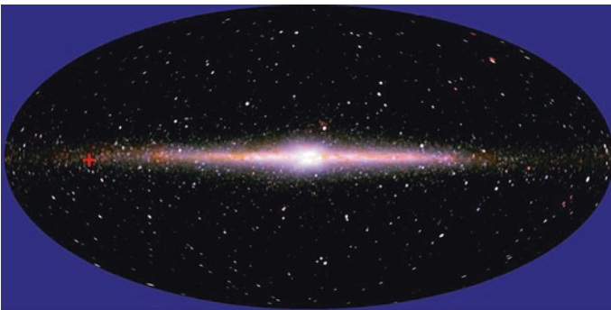
Abb. 2.3 Milchstraße mit Sonnenposition, © NASA, GSFC, COBE

Die Frage, wie unser Sonnensystem entstanden ist, ist immer noch nicht endgültig beantwortet. Das wird schon daran ersichtlich, dass weiterhin Sonden zu anderen Planeten geschickt werden, um Hinweise auf die Entstehungsgeschichte zu erhalten. Spekuliert über die Entstehung wurde allerdings schon in frühen Zeiten. Bereits Immanuel Kant entwickelte im Jahre 1755 eine Theorie dazu, genannt Meteoritenhypothese. Er stellte sich eine