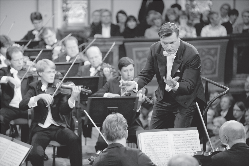
Mit den Wiener Philharmonikern 2008 bei der Aufführung von Beethovens neunter Symphonie im Goldenen Saal des Wiener Musikvereins