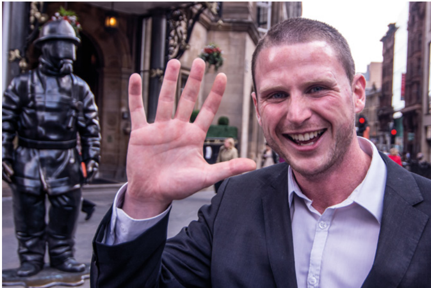
◀ Völkerverständigung mit einem sympathischen Waliser auf einer Einkaufsstraße in Glasgow, Schottland.

Nikon D5200 :: 24 mm :: ISO 640 :: f/4 :: 1/125 s