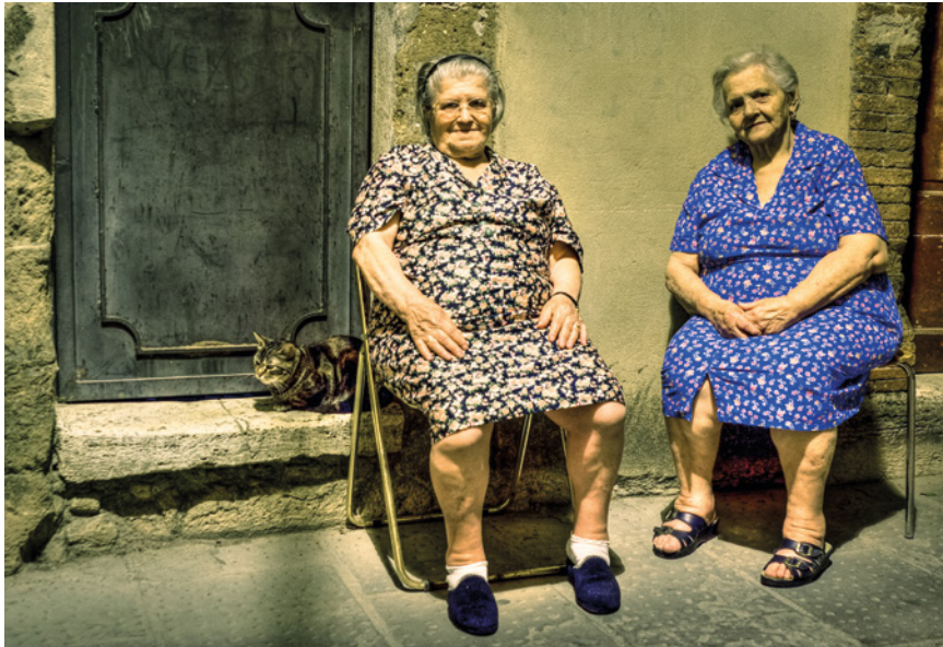
◀ Zwei ältere Damen sitzen abends mit ihrer Katze in den Gassen von Pitigliano, Italien.

Ich fange an zu grübeln und durchsuche meine Festplatten. Ich finde diverse Fotos aus Ländern wie England und Italien, aber auch aus exotischen Ländern wie Peru und Äthiopien in meinem Portfolio. Manche nah dran, manche mit einem Tele aufgenommen. Ich sehe die älteren Damen im Schatten ihrer Häuser in der alten Stadt Pitigliano sitzen oder den sympathischen Müllmann in Lima. Ich sehe den Straßenhändler aus Addis Abeba, der mir die Droge Kath anbietet, und das Kaugummi kauende selbstbewusste Straßenkind aus Cusco.