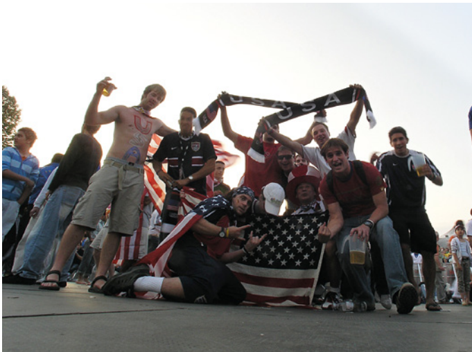
▲ Ein Pulk siegesicherer Amerikaner bei der Fußballweltmeisterschaft 2006 in München, Deutschland.

Olympus C5060WZ :: 12 mm :: ISO 200 :: f/8 :: 1/400 s