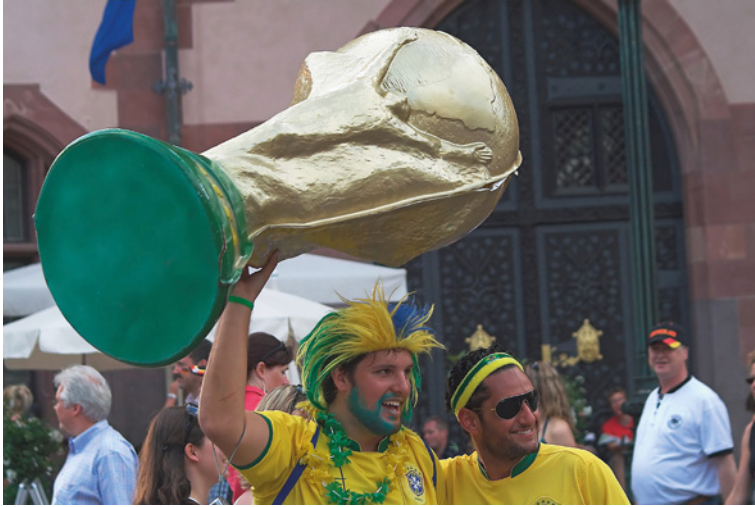
▲ Siegesichere Brasilianer beim Public Viewing der Fußballweltmeisterschaft 2006 in München, Deutschland.

Minolta Dynax 7D :: 75 mm :: ISO 800 :: f/4.5 :: 1/640 s