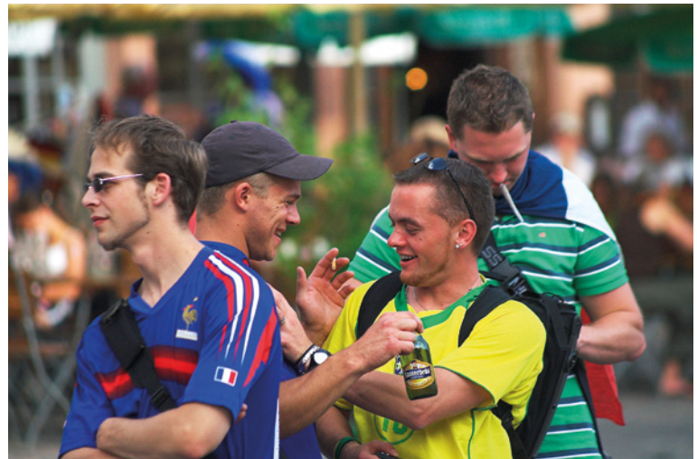
▲ So wie es sein soll! Völkerverständigung nach einem Spiel bei der WM 2006 in Frankfurt, Deutschland.

Olympus C5060WZ :: 12 mm :: ISO 80 :: f/8 :: 1/25 s