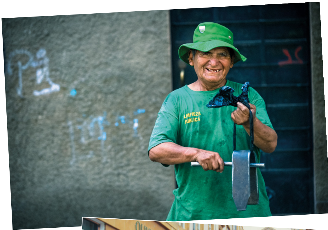
◀ Ein gut gelaunter Müllmann in Lima, Peru.

Nikon D700 :: 80 mm :: ISO 320 :: f/2.8 :: 1/400 s