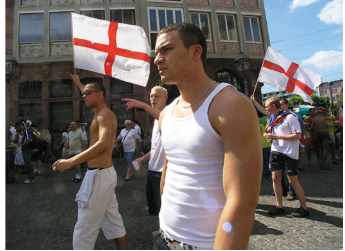
▲ Eine Gruppe Engländer auf dem Weg zum Viertelfinale in Frankfurt.

Minolta Dynax 7D :: 75 mm :: ISO 800 :: f/4.5 :: 1/640 s