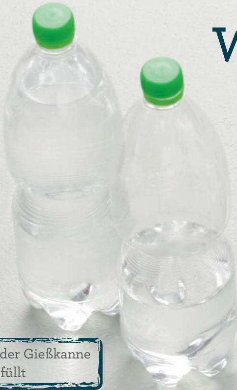
PET-Flasche oder Gießkanne mit Wasser gefüllt

Kreativ-/Knet-/Schmuckbeton, Beton-Effekt-Paste, Kunststoffgießformen, Schleifpapier zum Glätten des Betons, Gewichte zum Beschweren, z. B. mit Wasser oder Kieselsteinen gefüllte PET-Flaschen oder Tetra-Paks®